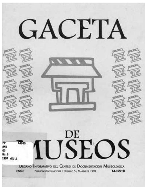
Portada del número 5 de la GACETA DE MUSEOS, marzo de 1997.