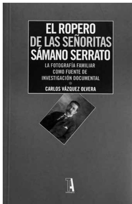
Libro publicado en 2013 por el INAH.