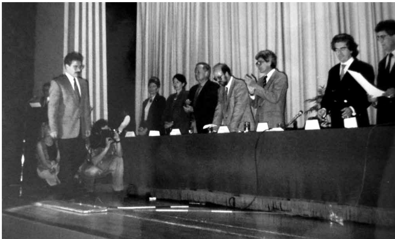
En la recepción del Premio Miguel Covarrubias 1994 a la mejor investigación de museos por el trabajo El Museo Nacional de Historia en voz de sus directores. Testimonio de sus proyectos de trabajo (1946-1992).