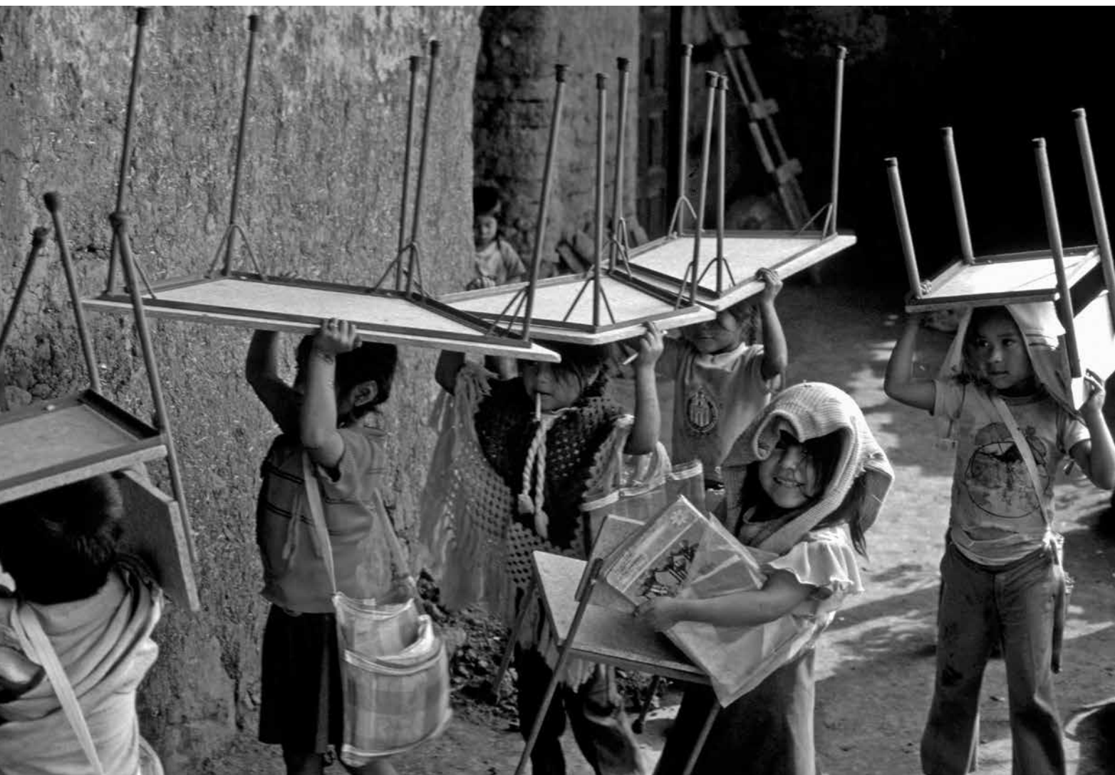
Condiciones de las escuelas rurales en la década de los setenta. Fotografía publicada en GACETA DE MUSEOS 34. Fotografía © Carlos Blanco Fuentes. FCNME.