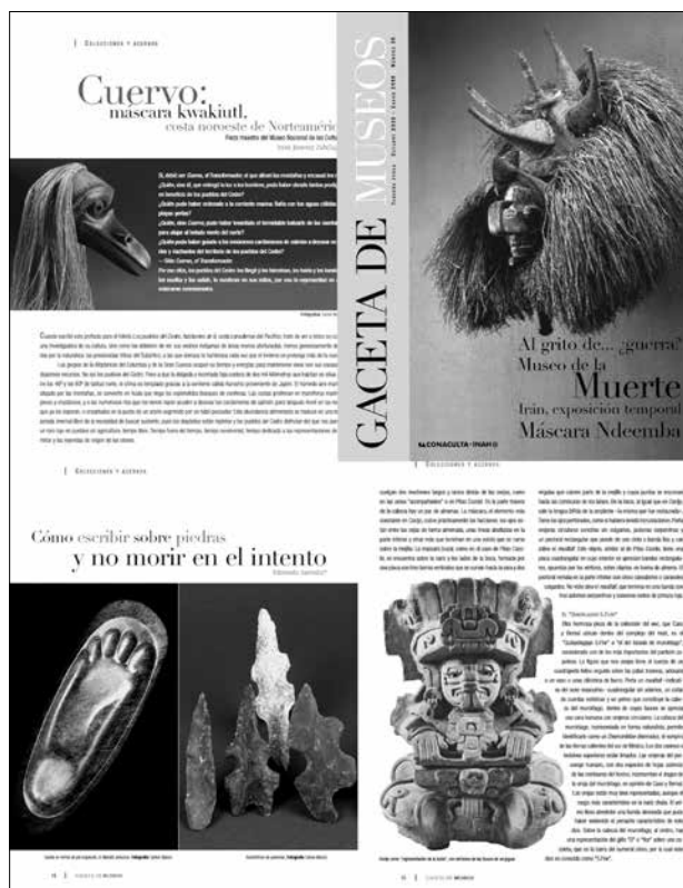
Portada y algunas de las páginas de GACETA DE MUSEOS donde aparecen fotografías de Carlos Blanco.