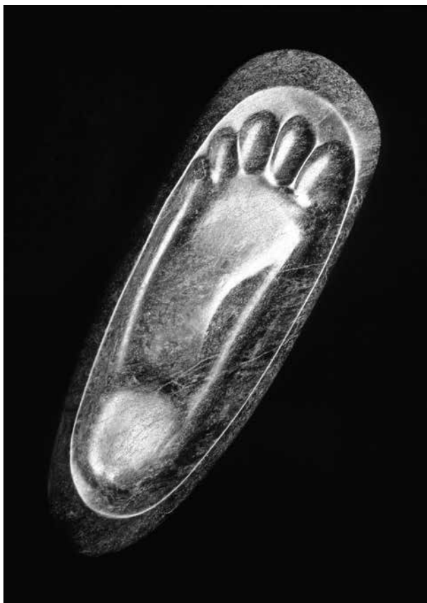
La foto fue portada de GACETA DE MUSEOS 35.

fotográfico que cubría gran parte del patrimonio a nuestro resguardo. La edición de pequeños folletos, llamados “miniguías”, avanzaban a paso decidido con una gran calidad fotográfica, textos redactados por especialistas y una cuidada impresión, además se vendían a bajo costo.