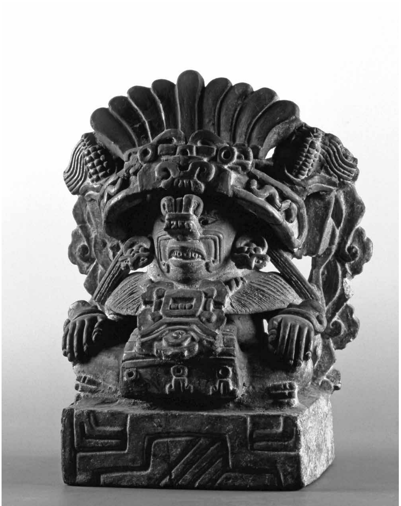
En GACETA DE MUSEOS 41 se publicó esta reprografía.