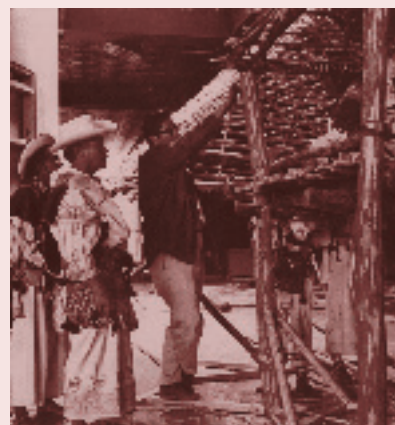
Montaje de casa huichola en el Museo Nacional de Antropología, 1963

Vázquez Olvera y Soto Soria sostuvieron reuniones de trabajo entre agosto de 1998 y julio de 2000, de las que resultaron veintitrés horas de grabación. Si bien la mayoría se celebraron en casa del entrevistado, en varias ocasiones se trasladaron al Museo Nacional de Antropología, donde explicó in situ sus ideas respecto a la planeación, el diseño, la producción y el montaje del proyecto de reestructuración de algunas salas permanentes. De esa interacción entre el investigador y el narrador/informante, en la que se respetó al máximo la transformación del lenguaje oral al escrito y que incluyó una revisión conjunta para determinar la forma y el contenido del libro, se obtuvo la historia de vida del museógrafo. En otras palabras, su "autobiografía" ✂