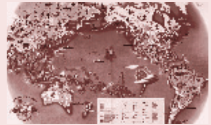
Economía del Pacífico, 1939, 12 paneles,