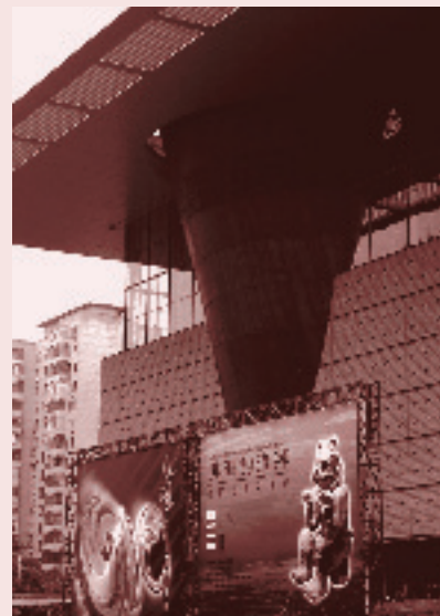
Museo de la Capital de Beijing