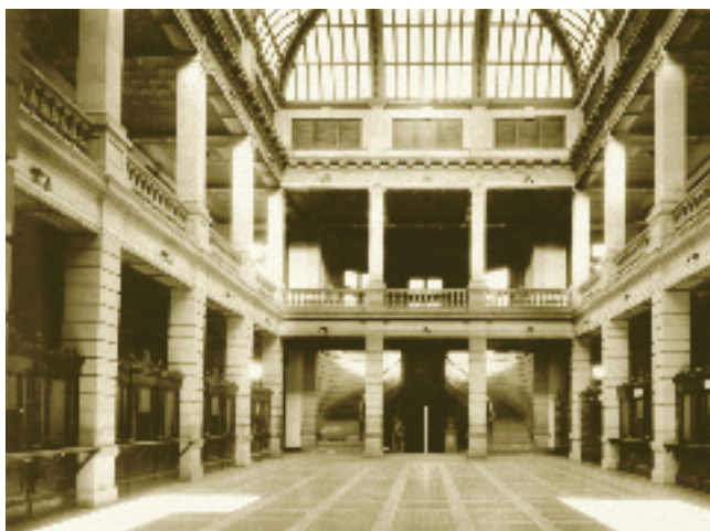
Vista del interior del Palacio Federal desde la planta baja