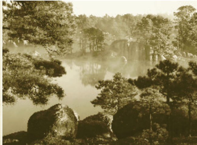
Gráfico para el nicho de patrimonio natural (exposición permanente)

especificaciones de los medios electrónicos elaborados tanto para el museo de sitio como para la exposición permanente.