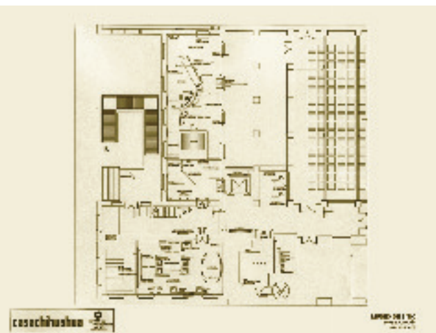
Planta museográfica del museo de sitio (sótano)

—con las oficinas tanto de correos como de telégrafos—, hasta su transformación en Casa Chihuahua.