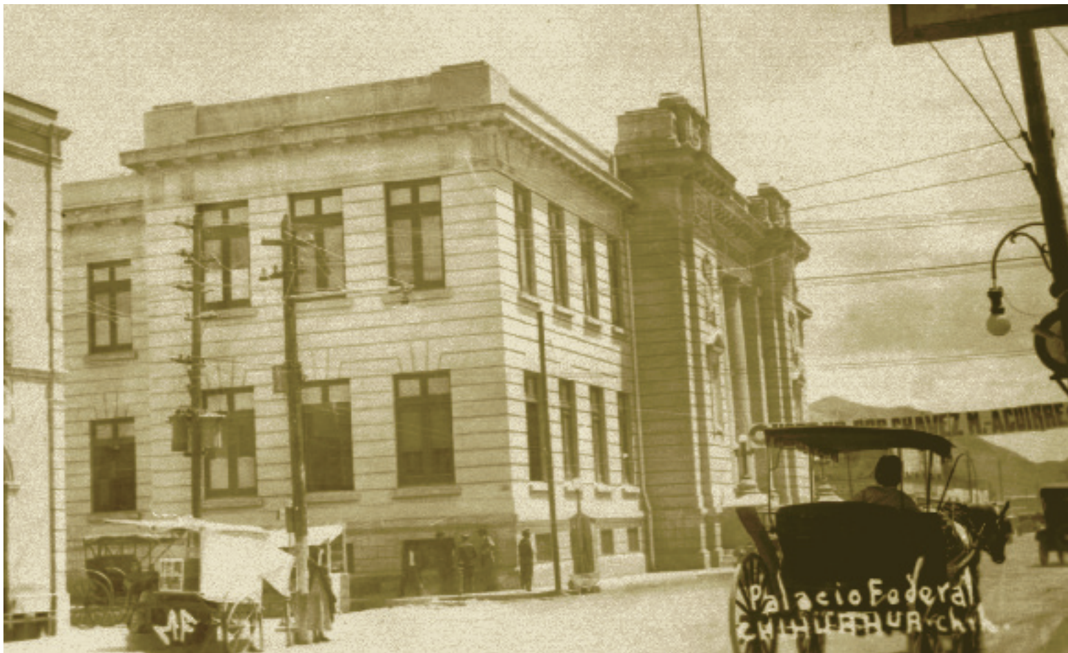
El Palacio Federal o Postal, hoy Casa Chihuahua, a principios del siglo XX

identidad de los chihuahuenses y se fomente el interés por las manifestaciones de otras culturas del país y del mundo en distintas épocas.