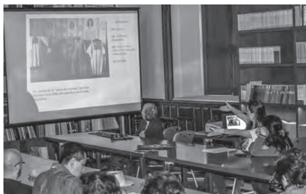
Sesiones del Seminario de Curaduría de Colecciones Etnográficas, 2014