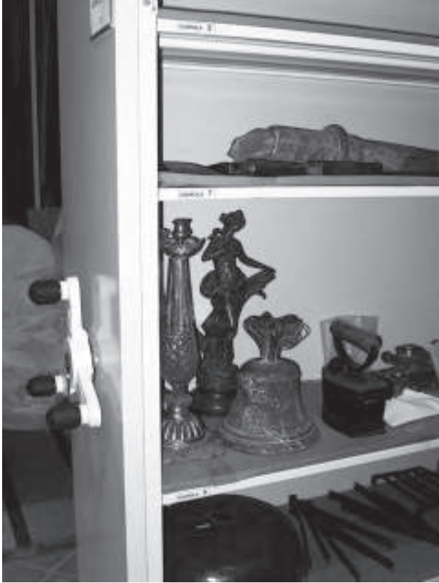
(Arriba y abajo) Disposición de colecciones: avances