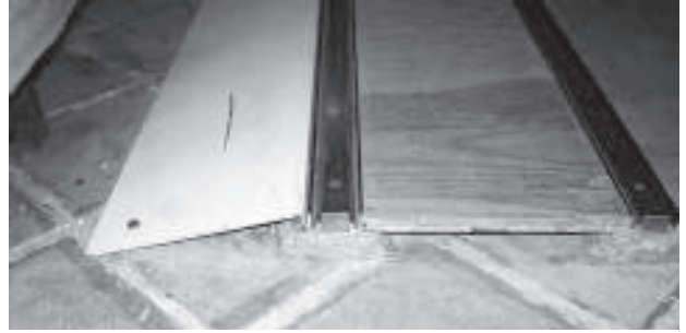
Anclaje de estructuras auxiliares

custodios, vigilantes y de limpieza, entre otros), para que adquieran la visión correcta sobre lo que significa un almacén de colecciones y contribuyan a su funcionamiento adecuado.