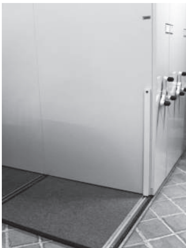
Muebles nuevos instalados

prioritaria un almacén con tales condiciones. En resumen, para instalar un almacén de colecciones en forma acertada se requiere generar un proyecto teórico-conceptual que trascienda la simple distribución de los muebles y los objetos dentro de los metros cuadrados disponibles para ese fin.