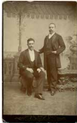
Enrique C. Creel y acompañante, ca.1895.