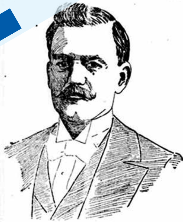
Francisco Mallén The Mexican Consul to El Paso