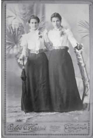
Mujeres abrazadas, ca.1900.

Jorge Meléndez Fernández Conservación fotográfica jorge_melendez@inah.gob.mx