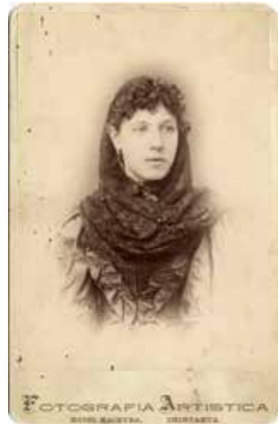
D.R., 1894. Fotografía: Pedro M. Hermosillo, “fotografía artística”. FotoINAHChih.