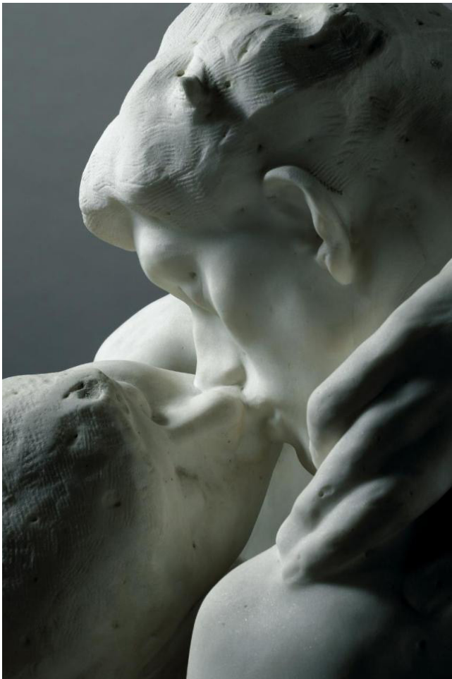
Escultura "El beso" de Auguste Rodin (1889).