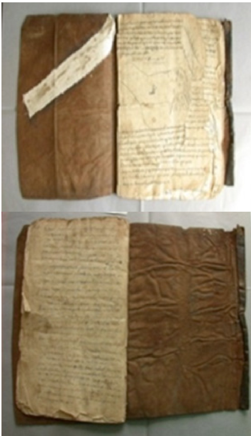
Figura 1. Fotos del cuaderno que incluye el Título de Coatepec. Las imágenes que se presentan en el presente trabajo son antes de la restauración que hicieran del título.

Las fojas en la parte central tienen una filigrana en posición vertical. Esta consta de tres círculos, y remata en la parte superior con una cruz. En forma descendente el primero tiene una media luna, en el segundo la imagen no es muy visible, en el tercero aparece una letra que podría ser la “I” en mayúscula o el número 1, (en caso que lo fuera esto último) indicaría la calidad del