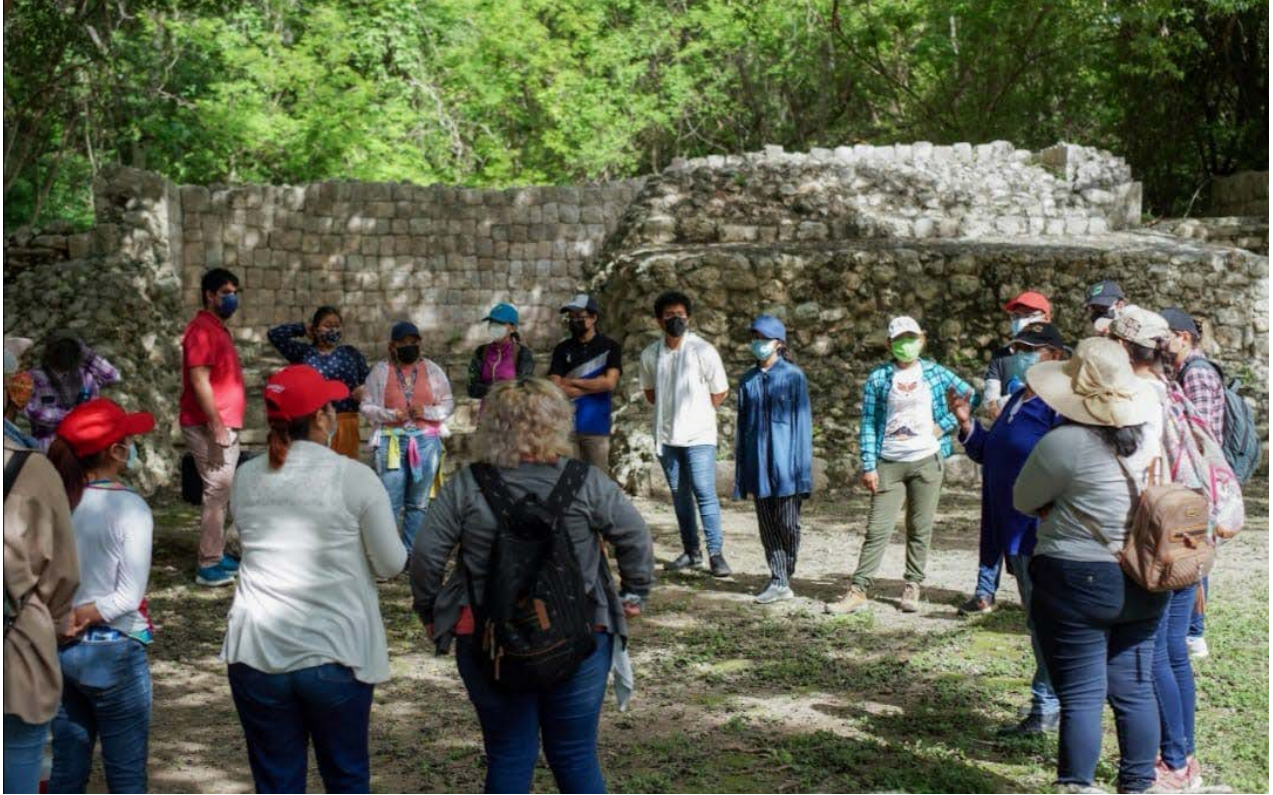
Foto 6. Práctica de campo en Edzná, Campeche (Área de profundización en Arqueología y Antropología Social).