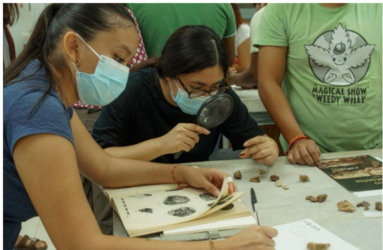
Foto 5. Análisis de materiales arqueológicos en el Laboratorio de Antropología de la Facultad de Ciencias Sociales (Área de profundización en Arqueología).