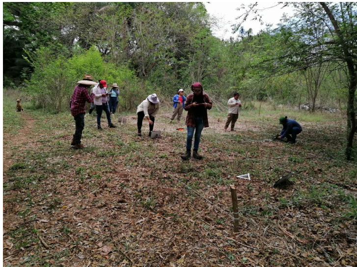
Foto 4. Práctica de excavación (Área de profundización en Arqueología).

De esta manera, el estado de Campeche contará, a corto plazo, con el personal suficiente para profundizar en investigaciones arqueológicas y antropológicas que enriquecerán el conocimiento sobre los asentamientos mayas prehispánicos y la cultura indígena actual.