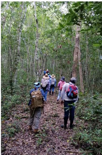
Foto 3. Práctica de recorrido de superficie en el sitio arqueológico de Oxpemul, Campeche (Área de profundización en Arqueología).