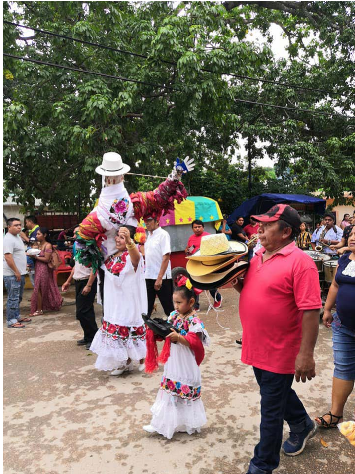
Foto 1. Ritual del Caballero de Fuego, Nunkiní, Campeche (Área de profundización en Antropología Social). Archivo Licenciatura en Antropología de la Facultad de Ciencias Sociales, Universidad Autónoma de Campeche.

coinciden con el último censo de población 2020 (INEGI, 2020)-, así como diversas expresiones culturales, entre las que se encuentran las fiestas, vestimenta popular, música y bailes tradicionales y elaboración de diversas artesanías, las cuales varían de región a región (UAC, 2015).