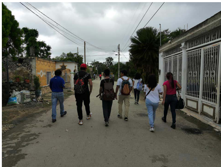
Foto 2. Trabajo de campo en comunidades del Estado de Campeche (Área de profundización en Antropología Social).

En el año 2022, egresó la primera generación de antropólogos y arqueólogos de la Universidad Autónoma de Campeche, quienes se han formado profesionalmente para investigar el patrimonio