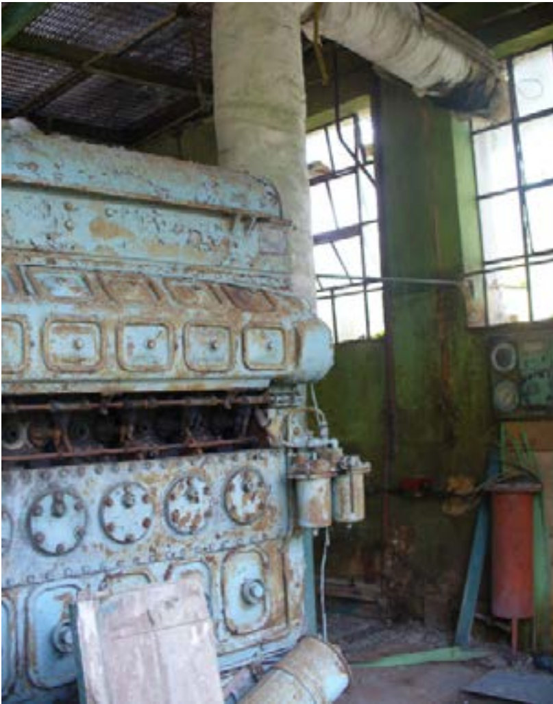
Restos de maquinaria en una antigua nave de la fábrica maderera. Colonia Yucatán, 2008.

todo el periodo. Sin embargo, se dedicaron varios artículos de la revista Frente a la selva a la difusión de información preventiva, emanada de la perspectiva biomédica hegemónica, que tendía a rechazar los tratamientos ligados a la cultura y prácticas locales. Estos artículos indicaban cómo reconocer las serpientes venenosas locales, como barba amarilla, nauyaca o cuatro narices ( Bothrops asper ), y huolpoch ( Agkistrodon bilineatus ), pues de su correcta identificación dependían el tratamiento y pronóstico del afectado 4 ; las mordeduras de estas serpientes se caracterizaban por presentar dos “heridas puntiformes... en ocasiones sangrantes y dolorosas” (Ríos Macbeth, 1950b, p. 16).