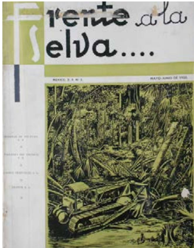
Portada del número 3 de la revista Frente a la selva, con una ilustración de Óscar S. Frías.

que se reventó la soga, que se le cayeron rolos; ya me había acostumbrado a oír que se morían. Mi marido se accidentó una vez, pero no murió; el carro [donde llevaba con troncos] se volteó; estuvo internado. Pues siguió trabajando; lo ponían a marcar rolos en el tumbo, con sus muletas, sentado. No había accidentes de trabajo en esa época; si no trabajaba uno, no comía." R. González.