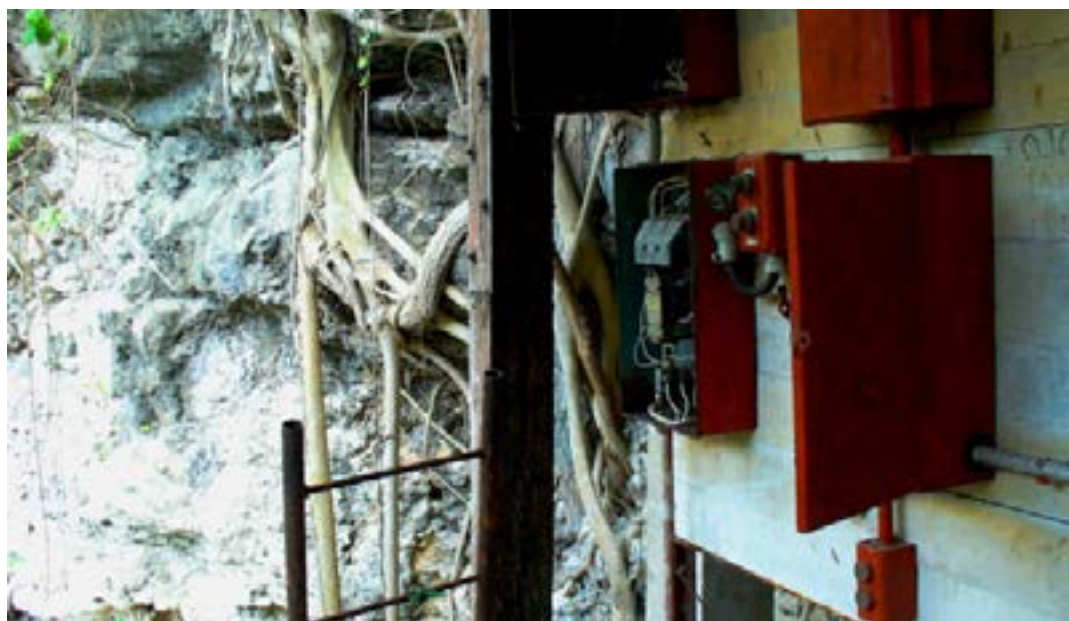
Instalación eléctrica en el cenote contiguo a la fábrica maderera. Colonia Yucatán, 2008.

todo, accidentes que costaron la vida a un número aún inestimable de trabajadores, algunos de ellos menores de edad. Sólo entre 1945 y 1951, los informes del médico reportaron 16 defunciones por accidentes, en contraste con las 31 fatalidades atribuidas a enfermedades durante el mismo periodo (Ríos Macbeth, 1951, p. 23). Los testimonios de tres personas nacidas en la década de 1930 permiten aproximarse a la vivencia de estos accidentes 5 .