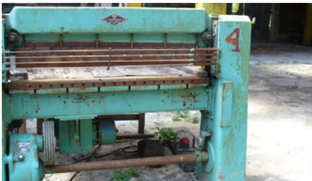
Restos de maquinaria en una antigua nave de la fábrica maderera. Colonia Yucatán, 2008.

de los años cincuenta publicó en la revista Frente a la selva varios informes y artículos que permiten identificar los problemas de salud que aquejaban a la población trabajadora, así como las formas de atenderlos 3 . La información permite apreciar que, pese a su relativo aislamiento, las prácticas médicas de la empresa maderera estaban articuladas a las políticas salubristas nacionales y a los principios de la medicina tropical que dominaba el escenario global.