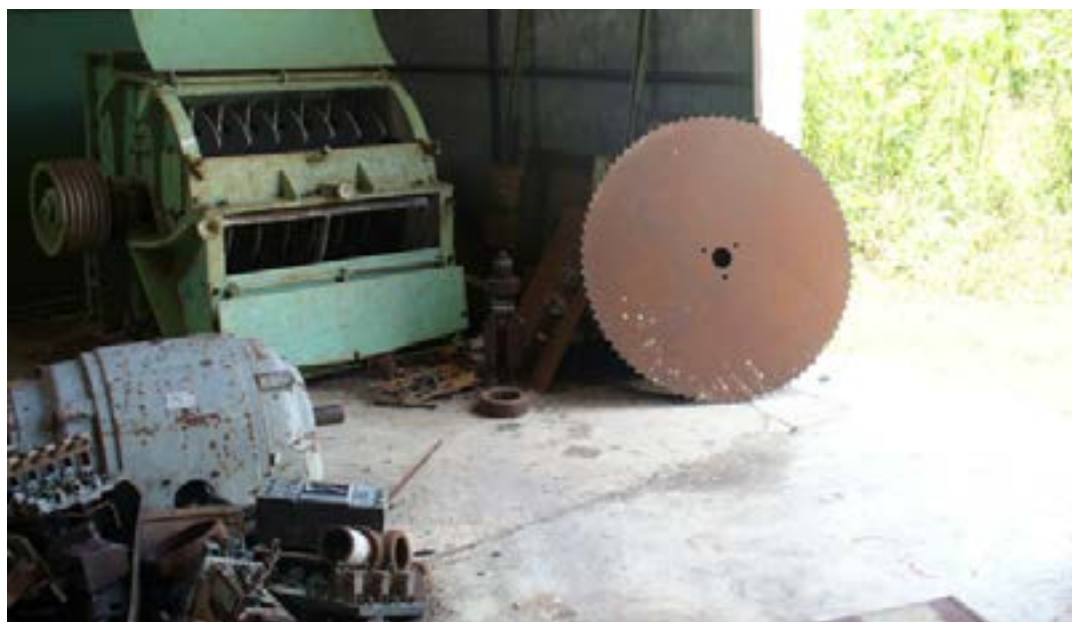
Restos de maquinaria en una antigua nave de la fábrica maderera. Colonia Yucatán, 2008.

vora o calomel (cloruro de mercurio), pero el doctor Ríos criticaba estos tratamientos porque producían necrosis. También prohibía otras terapéuticas populares, como la ingesta de alcohol, estrictinina, morfina y ácido acetilsalisílico (aspirina), que agravaban el cuadro. Paradójicamente, en sus inicios el hospital empleó viperol —una preparación de la herbolaria regional—, a la que se sustituyó posteriormente con el “suero antibotrópico brasileño”, y con el suero anticrotálico del Instituto de Higiene de México (Ríos Macbeth, 1950b).