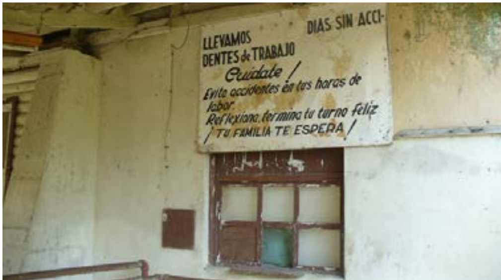
Letrero en una antigua nave de la fábrica maderera. Colonia Yucatán, 2008.

En 1945, el empresariado creó un departamento de previsión social dirigido a la “higienización de las zonas en que operan [las] compañías, así como a la prevención y curación de enfermedades endémicas y atención quirúrgica”, además de la higiene escolar y atención materno-infantil (Ríos Macbeth, 1950a, p. 2; 1951, p. 21). Ese año se instalaron dos hospitales en los principales espacios productivos: Zoh Laguna, Campeche, y Colonia Yucatán, en el municipio yucateco de Tizimín.