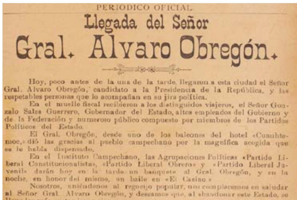
Programa de la visita de Álvaro Obregón a la ciudad de Campeche. 4 de septiembre de 1920.

los integrantes del Pro-Campeche, en el transcurso de febrero de 1919 a septiembre de 1920, en cuyo periodo, los campechanos acogieron las pretensiones de Obregón en las votaciones del 5 de septiembre de 1920.