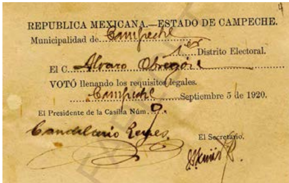
Constancia de votación de Álvaro Obregón en la ciudad de Campeche. 5 de septiembre de 1920.

Los obregonistas coexistieron con los partidarios del régimen carrancista, para que su encomienda proselitista se ejecutara en contra de los gobernantes en turno y de sus huestes; por lo que estuvieron limitados y desarticulados 9 . Con todo en contra, trabajaron por una misma causa. A Carrillo Puerto se le acusó de estar en ambos bandos, ante los ataques que el Partido Socialista sufrió por la milicia 10 , pero soportó la presión y asumió la dirección de la campaña, no solamente en Yucatán, sino en los límites de Campeche e incursión en Tabasco y Chiapas, tal como lo expresó a Obregón, en julio de 1919 11 .