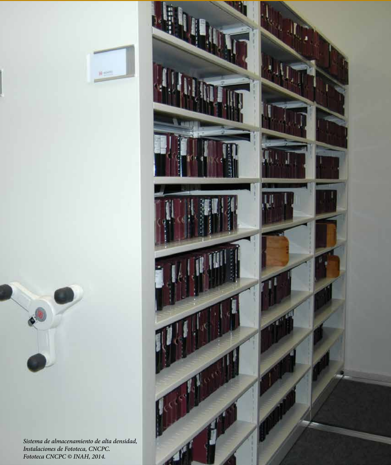
Sistema de almacenamiento de alta densidad, Instalaciones de Fototeca, CNCPC.