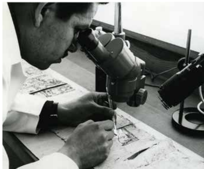
Proceso de descosido, luz normal, fotógrafo Arena. Fototeca, CNCPC © INAH, enero 2, 1968.

El álbum del Códice Moctezuma, por ejemplo, cuenta con un total de 90 fotografías, fechadas del 30 de octubre de 1967 al 9 de enero de 1968, en el álbum podemos encontrar tomas fotográficas realizadas con luz normal, luz de sodio, luz ultra violeta, radiografías del bien cultural y del proceso de descosido realizado en el laboratorio de química. Es una serie fotográfica digna de ser consultada.