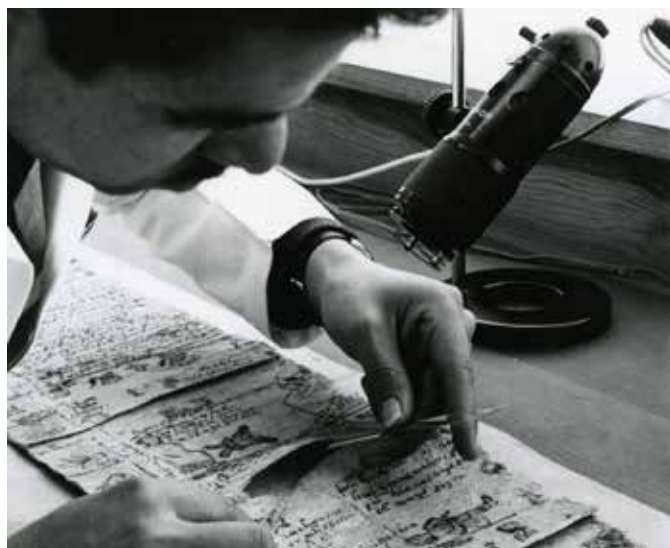
Proceso de descosido, luz normal, fotógrafo Arena. Fototeca, CNCPC © INAH enero 2, 1968.

La fototeca de la CNCPC no sólo se enriquece con las fotografías de los procesos de restauración realizados a los bienes culturales; además de ellas, podrán encontrar , entre otros, las radiografías que se han producido y que dan muestra de una vasta información sobre los bienes intervenidos.