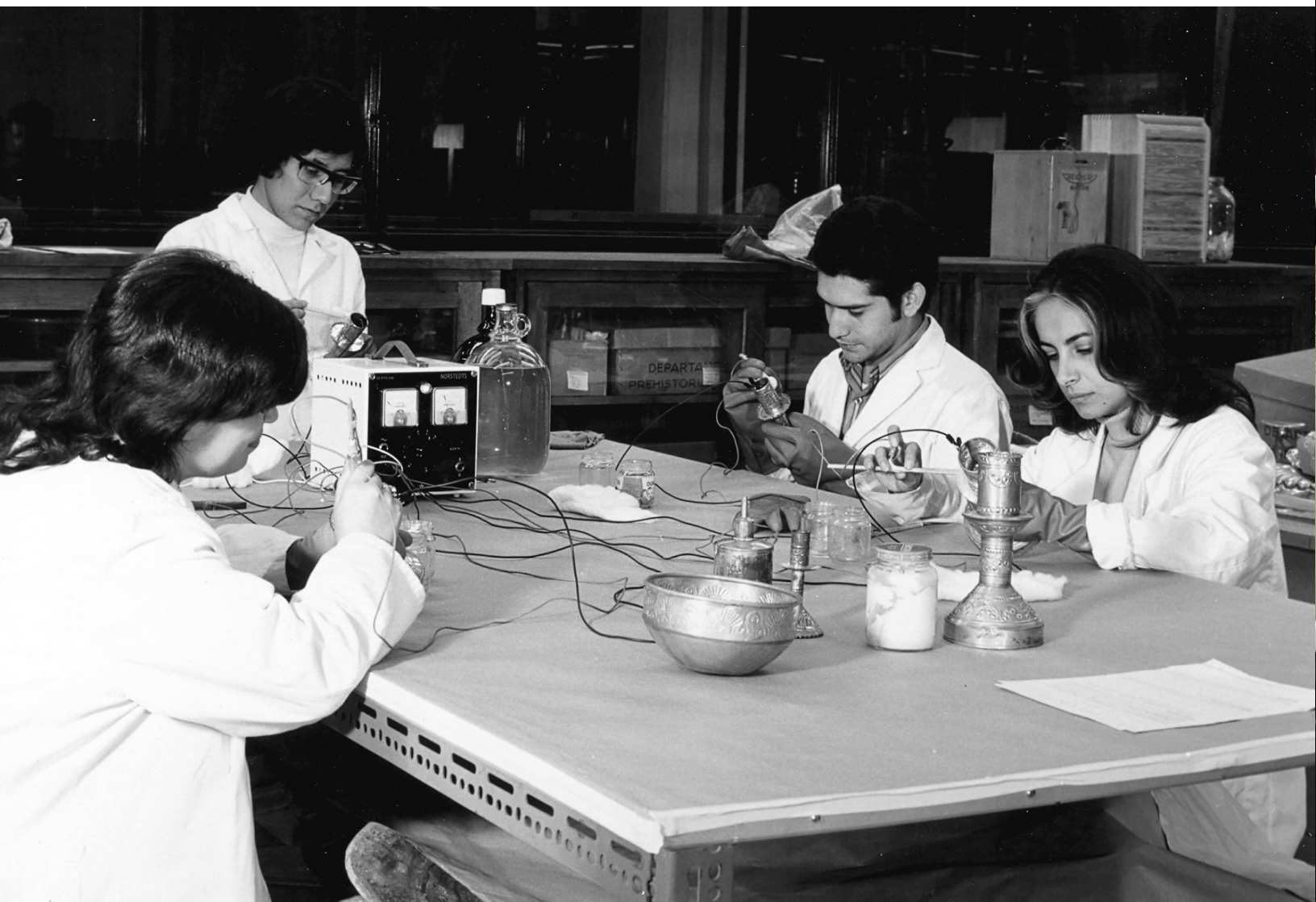
Práctica de alumnos, piezas de hoja lata, reducción electrolítica local, fotografía Sra. Groth. © Fototeca CNCPC - INAH, 1972