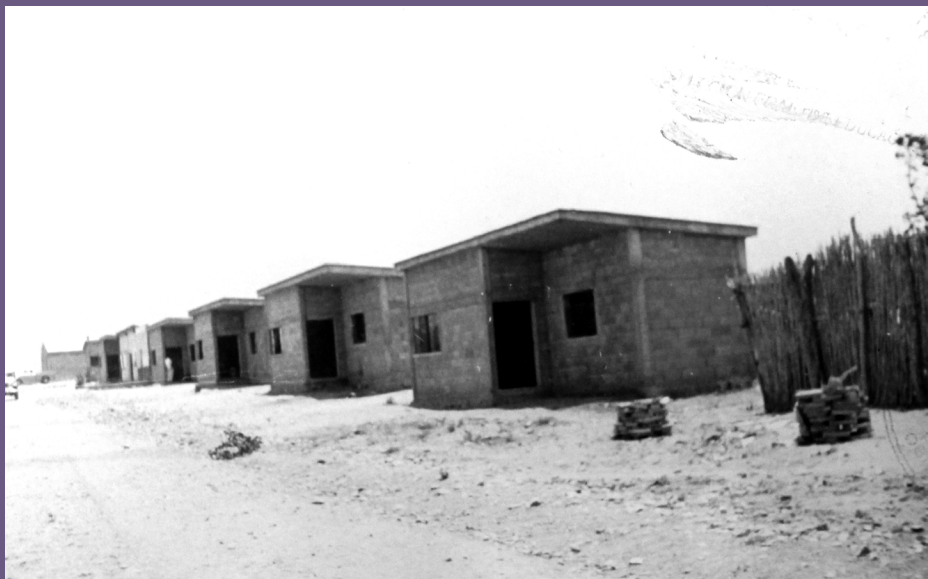
⤴ Archivo Histórico del Agua, Fondo AS, Exp. 43806, Caja 3187, Construcción de nuevas casas para los pobladores de Jalapa del Marqués, Oax., ca., 26 de septiembre de 1961.