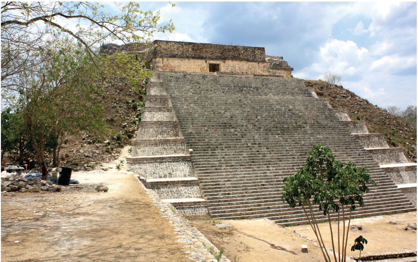
Uxmal, Yucatán, Foto: Alejandro Navarrete /Archivo DPM.

ha asesorado, impulsado, defendido las nominaciones y logrado la inscripción de 8 bienes culturales y 1 mixto que han sido inscritos en la Lista del Patrimonio Mundial , así como acompañado a la Comisión Nacional de Áreas Naturales Protegidas (CONANP), en el reconocimiento de 4 sitios naturales por parte de la UNESCO durante el mismo periodo.