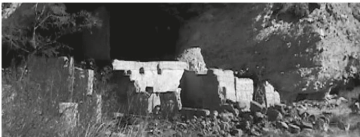
Sito El Mirador en el conjunto Huápoca, México.

El pasado 29 de enero de 2002 el presidente de la República Mexicana, licenciado Vicente Fox Quezada tuvo a bien expedir en el Diario Oficial de la Federación, el decreto de “Zona de Monumentos Arqueológicos” del sitio conocido como “Las Cuarenta Casas”, que se localiza en el municipio de Ciudad Madera y comprende una extensión de 248 hectáreas, misma que se distribuye a lo largo del cañón conocido como Barranca del río El Garabato. En sus cuevas y abrigos presenta pequeños multifamiliares de dos niveles construidos con tierra modelada, representan la mejor tradición del estilo Paquimé y forman pequeños cuartos de planta cuadrada y rectangular, o también algunas plantas compuestas que cumplieron diferentes funciones en la vida cotidiana de sus moradores. Fueron espacios empleados como habitaciones, comedores, plazas interiores, corredores, pasillos, sitios sagrados, graneros, corrales, almacenes y talleres principalmente. La declaratoria federal constituye una muestra decisiva en materia de protección del patrimonio y otorga al bien un sustento legal para su defensa. Al mismo tiempo, éste es el resultado del proyecto para la conservación integral del patrimonio cultural de la región de Madera, Chihuahua.