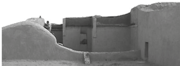
Unidad habitacional en Paquimé, México.

específicamente en las cuencas hidrográficas del río Papigochic y sus afluentes en la sección montañosa, donde también se organizan trabajos enfocados al desarrollo comunitario que integra a la sociedad en la protección y manejo de los recursos naturales y culturales.