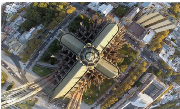
Catedral de La Plata. Vista desde un dron.

ble expansión a lo largo de las últimas seis décadas. Reservado en principio a las grandes obras maestras de la arquitectura y del urbanismo, el patrimonio incluye hoy una amplia gama de bienes que resultan testimonios de momentos específicos de la evolución del hombre como de formas y modos de concebir y materializar el entorno en que se desarrolla la vida humana.