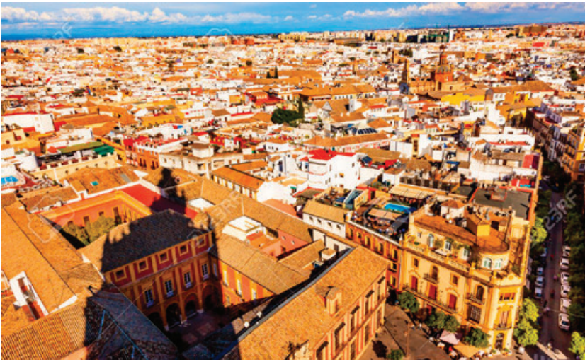
Paisaje urbano, vistas a la ciudad. Sevilla. España

En un mundo eminentemente urbano, complejo, diverso y heterogéneo no podemos dejar de pensar en la especificidad (o especificidades) de los paisajes culturales urbanos.