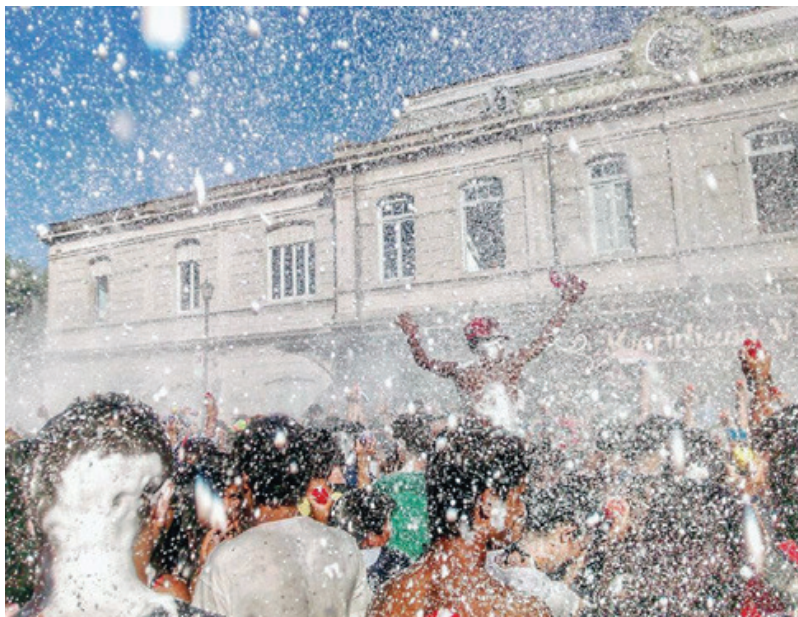
Carnaval. Estación FFCC Meridiano V. La Plata