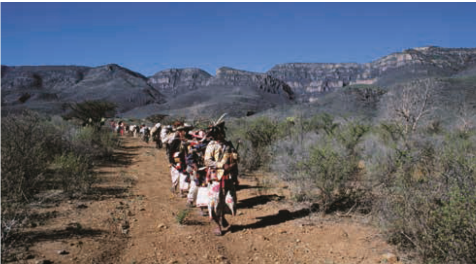
Los jicareros recorren la ruta en estricto orden de jerarquía. Jalisco.

forma parte del mismo espacio cultural y geográfico, sino que también es fruto de un mismo y valioso equipo de expertos que desde hace ya varios años, han dado continuidad a las actividades y a la lealtad y compromiso con sus preceptos básicos: las recomendaciones locales, nacionales e internacionales, para la conservación patrimonial.