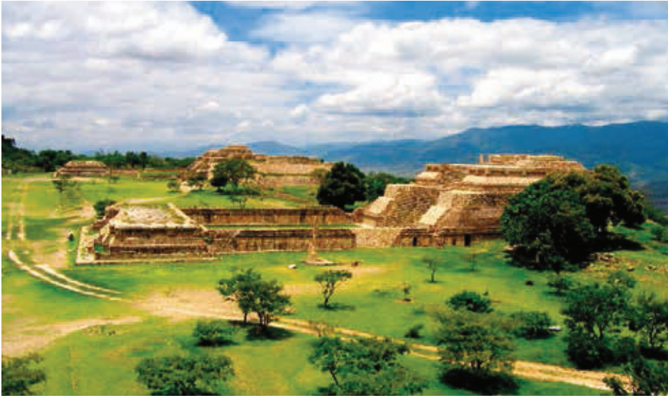
Ciudad prehispánica de Monte Albán.