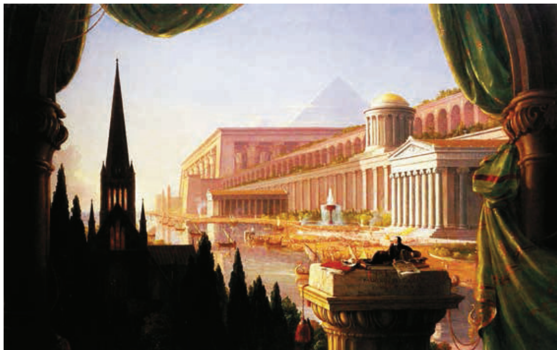
Thomas Cole, El sueño del arquitecto , 1840. Toledo Museum of Art (Ohio, USA).

Los sinodales consideraron en la calificación criterios en la presentación, nivel de preservación, experiencia y accesibilidad del visitante y la comodidad vacacional en la región circundante. Y es precisamente por ello que nos parece muy relevante dicho reconocimiento, pues el paisaje cultural de Las Cuevas Prehistóricas de Yagul y Mitla, no sólo