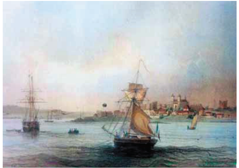
Vista desde el agua de Colonia del Sacramento en 1845.

El barrio Histórico de Colonia del Sacramento fue nominado para ser incluido en la Lista del Patrimonio Cultural de la Humanidad, por la UNESCO en diciembre de