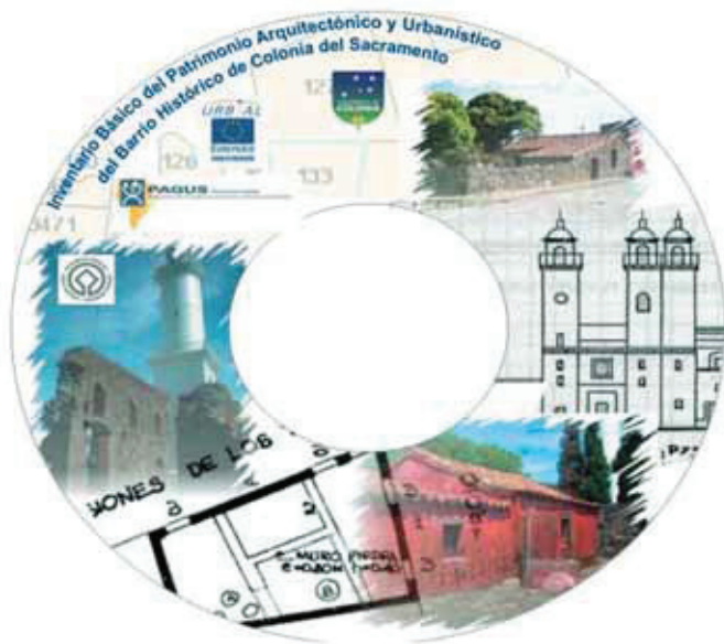
Carátula del CD Interactivo del Inventario del Patrimonio Arquitectónico y Urbanístico del Barrio Histórico de Colonia del Sacramento. IMC-URBAL 2007. Derecha Ficha tipo del inventario, hoja 1.