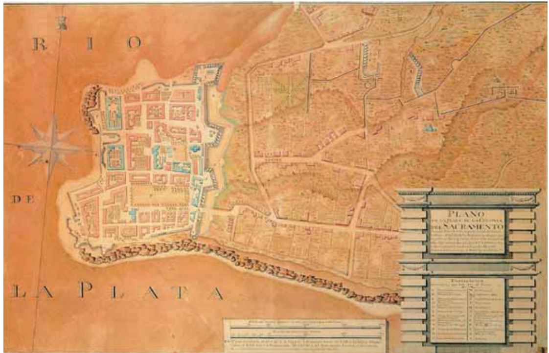
Imagen del trazado urbano actual del barrio Histórico de Colonia del Sacramento.