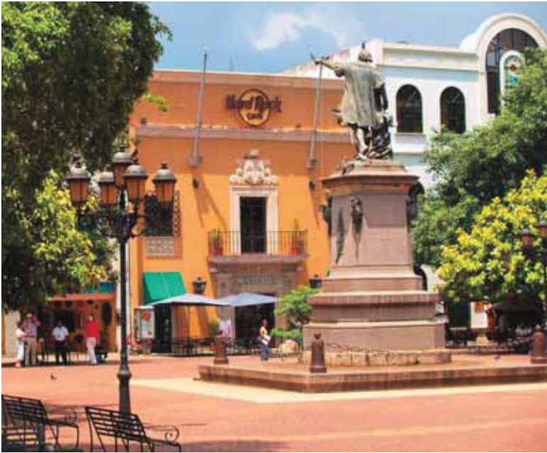
Santo Domingo, República Dominicana,

El patrimonio —señaló en aquél momento Federico Mayor— "somos nosotros mismos"