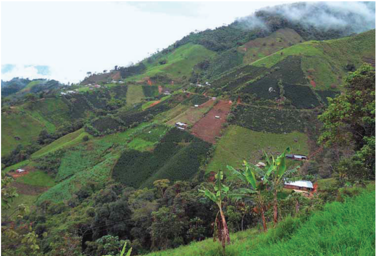
Paisaje cafetero, Colombia.

En cuanto a las rutas e itinerarios culturales, su concepción entraña la recuperación de contextos históricos y geográficos, representando el flujo de interacciones dialécticas que contribuyen a eliminar el aislamiento y sus secuelas. Itinerario significa movimiento de personas, ideas, mercancías, religiones, es decir el intercambio e interinfluencia que han conformado las culturas a lo largo de la historia. Así, cuando hablamos de itinerarios, estamos pensando en el trasiego de un