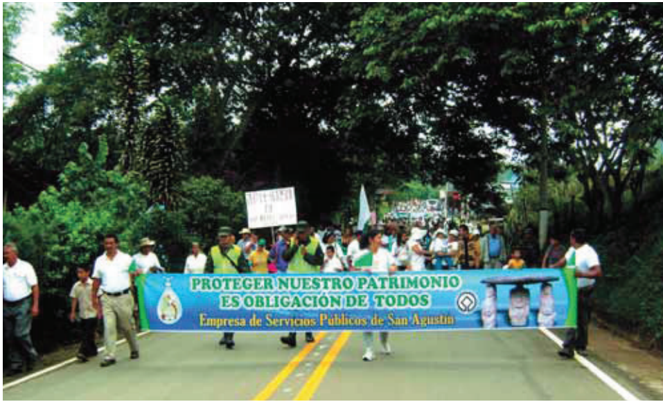
San Agustín, Colombia

características físicas de los bienes, en su integridad ecológica y diversidad monumental, en los sistemas de transporte, acceso, bienestar social, económico y cultural de las comunidades anfitrionas. Evaluaciones integrales de los impactos progresivos de la actividad turística deberán llevarse a cabo de manera regular.