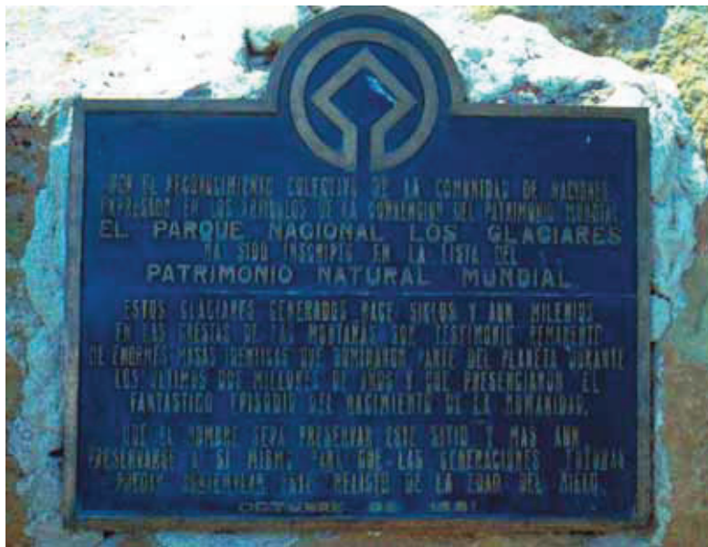
Parque Nacional los Glaciares, Argentina

comunidad para solventar los requerimientos cada vez mayores del turismo. Así entre el establecimiento de cerca de 70 negocios comerciales entre agencias de turismo, hoteles y panaderías, además de restaurantes que brindan en sus menús huevos y carne de tortuga, es que el medio ambiente ha sufrido una rápida degradación. Además de que la comunidad afronta ahora crecientes