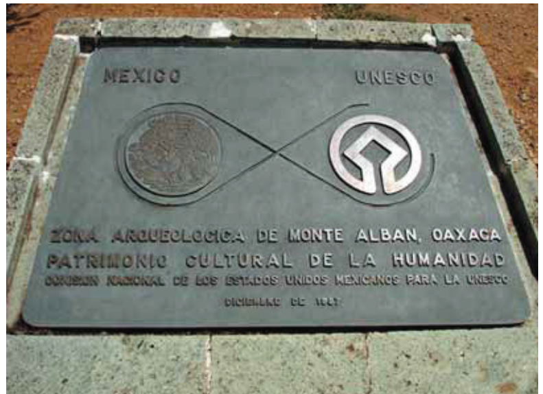
Monte Albán, Oaxaca.

El equilibrio entre la explotación turística y el rescate, conservación y salvaguardia del patrimonio cultural y natural, debe alcanzarse mediante políticas integrales —como ya lo habíamos mencionado antes— que consideren no sólo a los bienes y sitios, sino al entorno urbano o natural en que se encuentran, así como el respeto a las tradiciones y modo de vida de las comunidades.