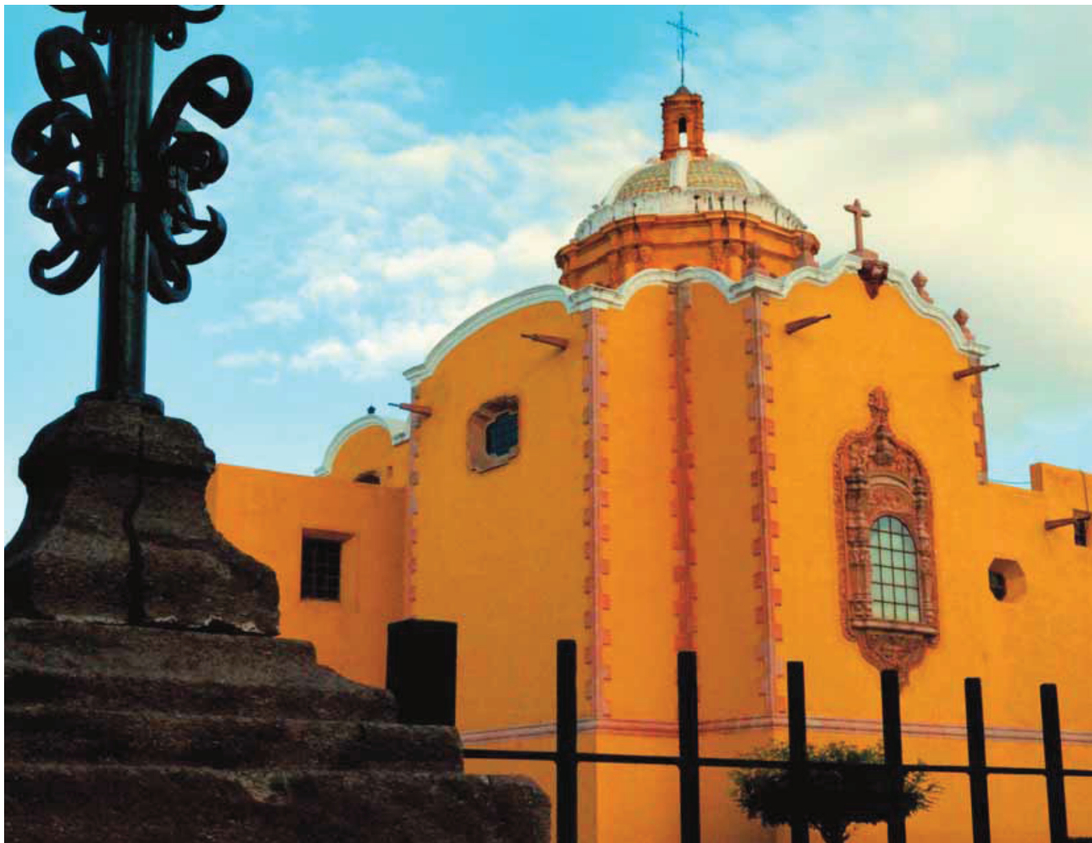
Capilla de Aranzazú San Luis Potosí