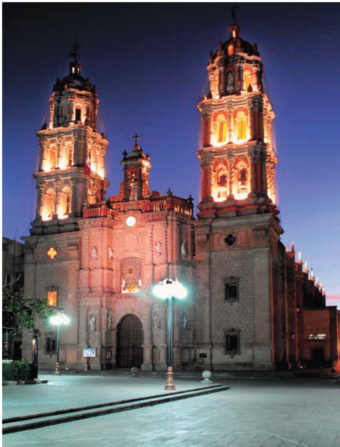
Catedral, San Luis Potosí