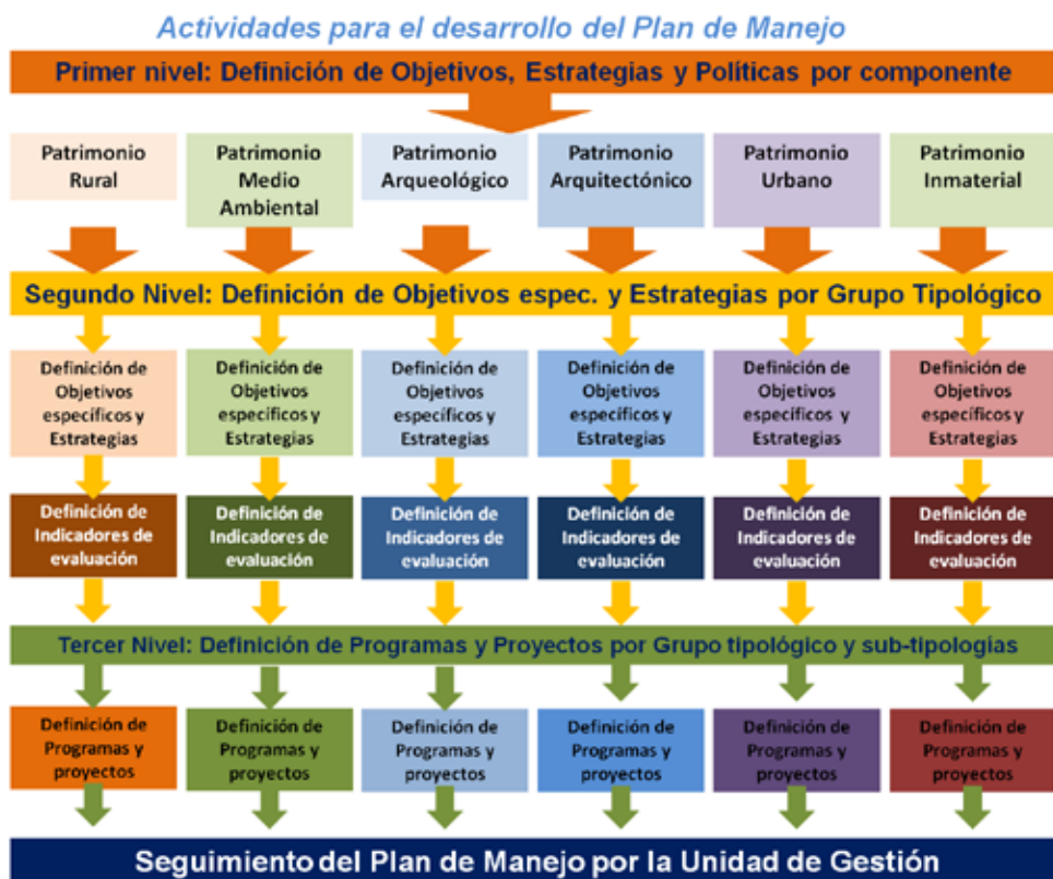
Gráfico que presenta las actividades propuestas para el desarrollo y evaluación de un plan de gestión elaborado para un sitio de escala territorial.

Descripción de los grupos tipológicos identificados como parte del componente de valor patrimonial del sitio.