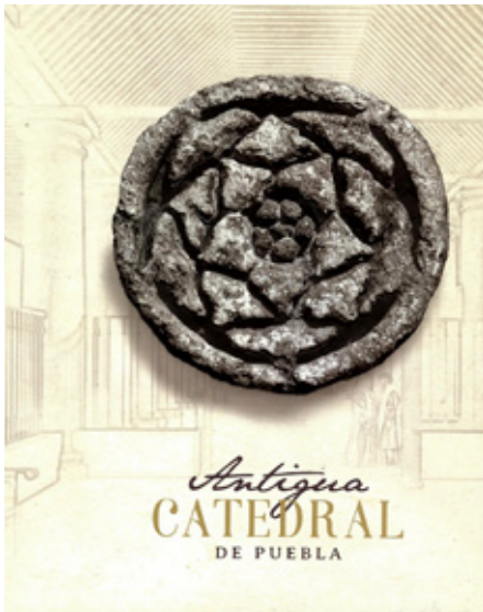
V.V.A.A. (2018). Antigua Catedral de Puebla . Puebla: Secretaría de Cultura y Turismo/Arquidiócesis de Puebla.

Este libro nos brinda una precisa tabla de tiempo que nos indica cómo la obra de la Antigua Catedral duró muchos años. El tiempo no pasó en vano y en esta historia se reflejan los avances en la tecnología utilizada por distintos constructores. La historia de este primer edificio, y el que vemos actualmente, nos muestran cómo evolucionó la construcción a medida que se fue estableciendo el virreinato de México: el contraste entre ambas es muy significativo.