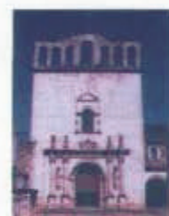
Symposium Internacional sobre Conservación del Patrimonio Nacional Diciembre 2003

Verdes, que aborda el problema de todas aquellas vías férreas nacionales que quedaron en desuso con finalidad de convertirlas en pistas para ciclistas, patinadores o corredores, o simplemente paseos orbeledados para goce y disfrute de los usuarios. Esta práctica tiende a establecer un parangón con el proceso que dado en Estados Unidos y Europa para conservación del patrimonio ferroviario. México ya ha incursionado en este tema al emprender su discusión, y plantear el plan piloto expuesto en este disco a través de buenas maquetas y animaciones.