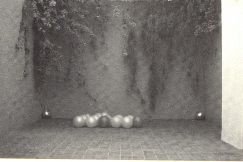
Casa Museo Luis Barragán, México.