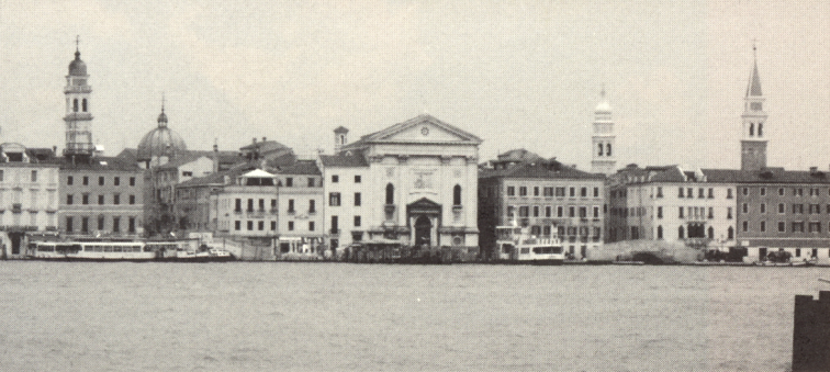
Ciudad histórica de Venecia.