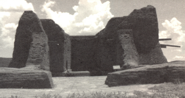
Nuevo México, EUA. / Aguascalientes, México.