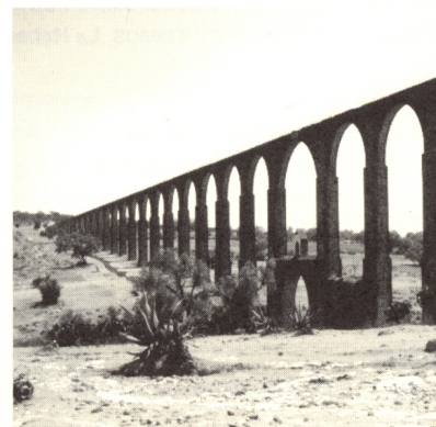
Acueducto del padre Tembleque, México.

Un aspecto de gran importancia se refirió a enfatizar la comprensión del carácter y el valor del Patrimonio Moderno, por lo tanto, se revisaron los métodos para selección y valoración de esta categoría de patrimonio en países representativos de la región de América Latina y Caribe, además de Estados Unidos y Canadá, mediante de encuentros previos. La reunión celebrada en Monterrey resumió las conclusiones alcanzadas por cada grupo de trabajo, con miras a establecer criterios para la selección y valoración del Patrimonio Moderno, para su nominación a la Lista de Patrimonio Mundial.