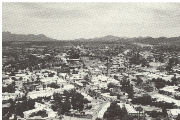
Poblado histórico de Alamos, Sonora.

En el año 2001 México envió al Centro de Patrimonio Mundial la Lista Indicativa por conducto de la Comisión Mexicana de Cooperación con la UNESCO (CONALMEX), para lo cual se hizo una amplia convocatoria entre las instituciones nacionales involucradas en la identificación y protección del patrimonio cultural de nuestro país: CONACULTA, INAH, INBA y la UNAM, principalmente. Cabe hacer mención que a diferencia de los balances presentados en la Lista de Patrimonio Mundial, la Lista Indicativa de México ya incluye categorías patrimoniales novedosas como es el caso del patrimonio moderno, el patrimonio industrial, los itinerarios culturales, los paisajes culturales y los sitios prehistóricos.