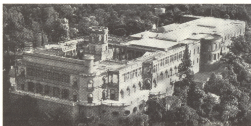
Castillo de Chapultepec, México.

● Garantizar la gestión de los sitios inscritos en la Lista, mismo hecho que implica la realización de informes periódicos de su estado de conservación. Este proceso de evaluación implica, entre otras cosas, la revisión de la permanencia de los valores de un sitio, o incluso su cambio y evolución hacia otros conceptos que expresan mejor su integridad.