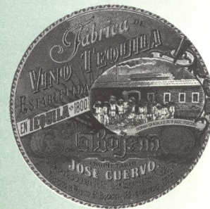
Panorámica del estadio de CU, México. Foto: Enciclopedia Histórica de México. / Etiqueta de tequila de la empresa José Cuervo, México. Foto: Jorge Vértiz.