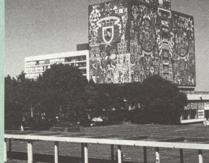
Sitio arqueológico de Cantona, Puebla. / Biblioteca Central de Ciudad Universitaria, México.