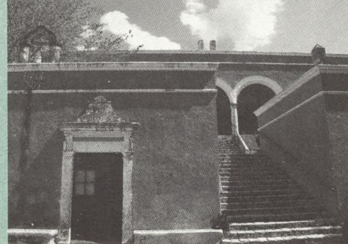
Ciudad de Budapest, Hungría. Foto: Francisco López Morales. / Hacienda de Uayamon, Campeche, México. Foto: Francisco López Morales.