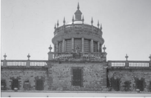
Cúpula de la Capilla Tolsá, México.