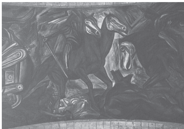
Caballo bicéfalo en la Capilla Tolsá, México.

El inmueble se constituye como una de las más relevantes e importantes manifestaciones culturales;