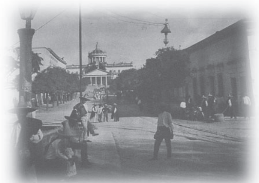
Panorámica del Hospicio Cabañas , México (1910).