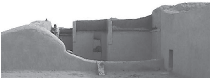
Unidad habitacional en Paquimé, México.

específicamente en las cuencas hidrográficas del río Papigochic y sus afluentes en la sección montañosa, donde también se organizan trabajos enfocados al desarrollo comunitario que integra a la sociedad en la protección y manejo de los recursos naturales y culturales.