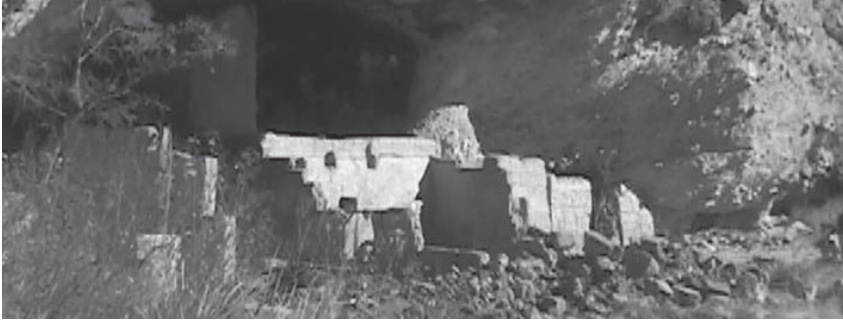
Sito El Mirador en el conjunto Huápoca, México.

El pasado 29 de enero de 2002 el presidente de la República Mexicana, licenciado Vicente Fox Quezada tuvo a bien expedir en el Diario Oficial de la Federación, el decreto de “Zona de Monumentos Arqueológicos” del sitio conocido como “Las Cuarenta Casas”, que se localiza en el municipio de Ciudad Madera y comprende una extensión de 248 hectáreas, misma que se distribuye a lo largo del cañón conocido como Barranca del río El Garabato. En sus cuevas y abrigos presenta pequeños multifamiliares de dos niveles construidos con tierra modelada, representan la mejor tradición del estilo Paquimé y forman pequeños cuartos de planta cuadrada y rectangular, o también algunas plantas compuestas que cumplieron diferentes funciones en la vida cotidiana de sus moradores. Fueron espacios empleados como habitaciones, comedores, plazas interiores, corredores, pasillos, sitios sagrados, graneros, corrales, almacenes y talleres principalmente. La declaratoria federal constituye una muestra decisiva en materia de protección del patrimonio y otorga al bien un sustento legal para su defensa. Al mismo tiempo, éste es el resultado del proyecto para la conservación integral del patrimonio cultural de la región de Madera, Chihuahua.