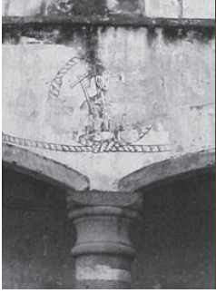
Aspecto del claustro en Tochimilco, México.

El conjunto conventual de Tochimilco se integra por los siguientes espacios: templo (Parroquia de Santa María de La Asunción), claustro, capilla abierta, capilla de la Tercera Orden, portal de peregrinos, aljibe, atrio, huerta, casa parroquial y sistema hidráulico (acueducto y caja de agua). En el claustro se encuentran pinturas murales que se aprecian en pequeños fragmentos, pues la mayor parte de los muros están cubiertos por capas de pintura a la cal, producto de los diferentes usos que ha tenido el edificio, y que al mismo tiempo, han servido para su protección.