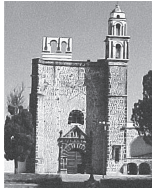
Fachada de la parroquia en Tochimilco, México.

Tochimilco, Huejotzingo y Calpan se ubican entre 18°43'11" y 19°09'27" de latitud norte, y entre 98°24'13" y 99°14'42" de longitud oeste aproximadamente, y se localizan a unos 50 kilómetros de la ciudad de Puebla, en la falda sureste del volcán Popocatepetl. En los dos primeros casos la edificación conventual se encuentra en el área central de la población, mientras que en Calpan se emplaza en las afueras del lugar. Actualmente, dichas estructuras arquitectónicas se usan por las comunidades, y están ligadas a la vida cotidiana de sus habitantes. Los aspectos social y religioso prevalecen como parte de una concepción amplia del patrimonio y no sólo del valor histórico o monumental.