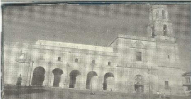
FOTO: Museo de las Artesanías, Morelia CRD: Proyecto México, Coordinación Nacional de Difusión.