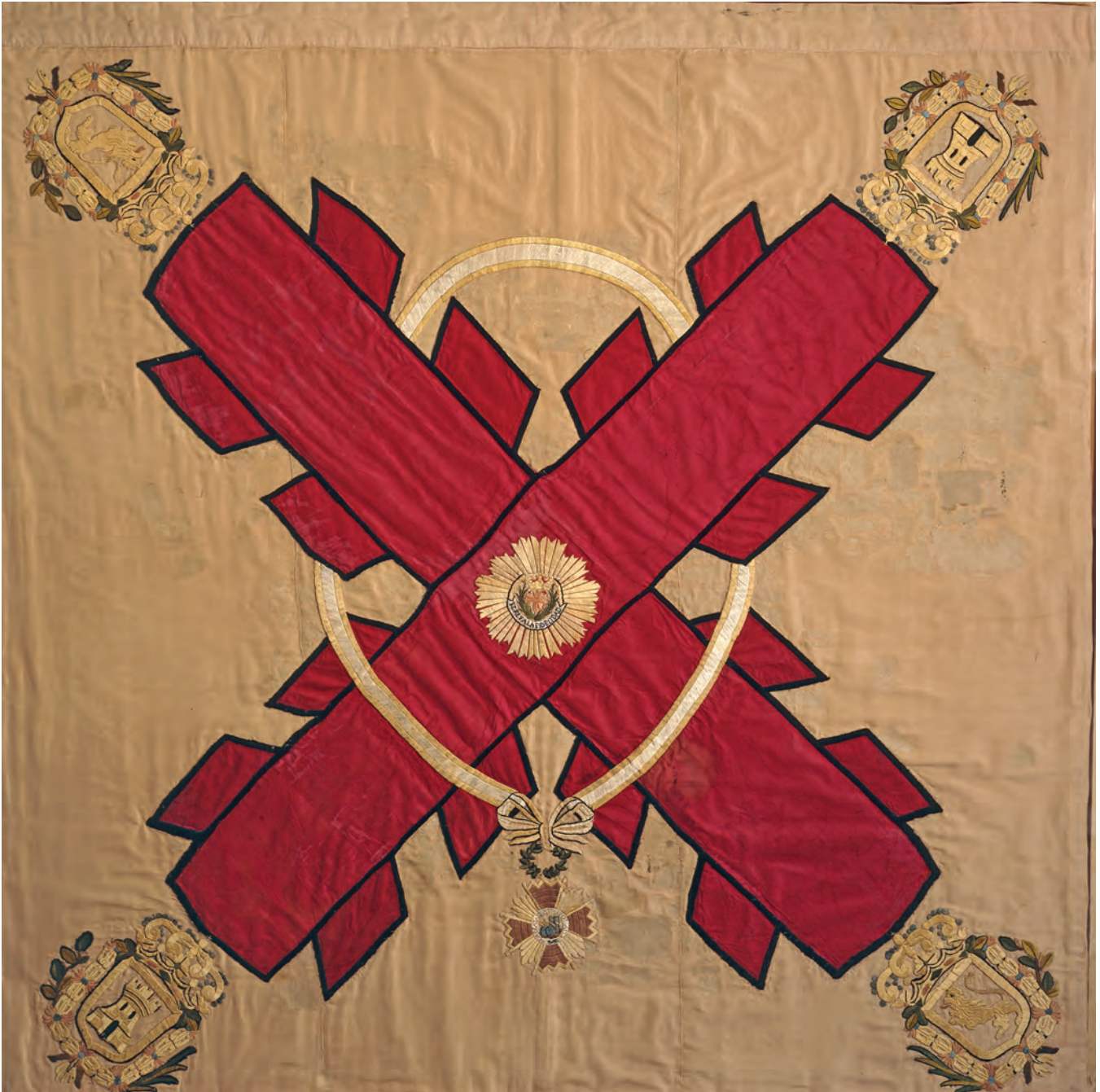
34. Bandera Cruz de Borgoña con la leyenda "El Rey a la Fidelidad".