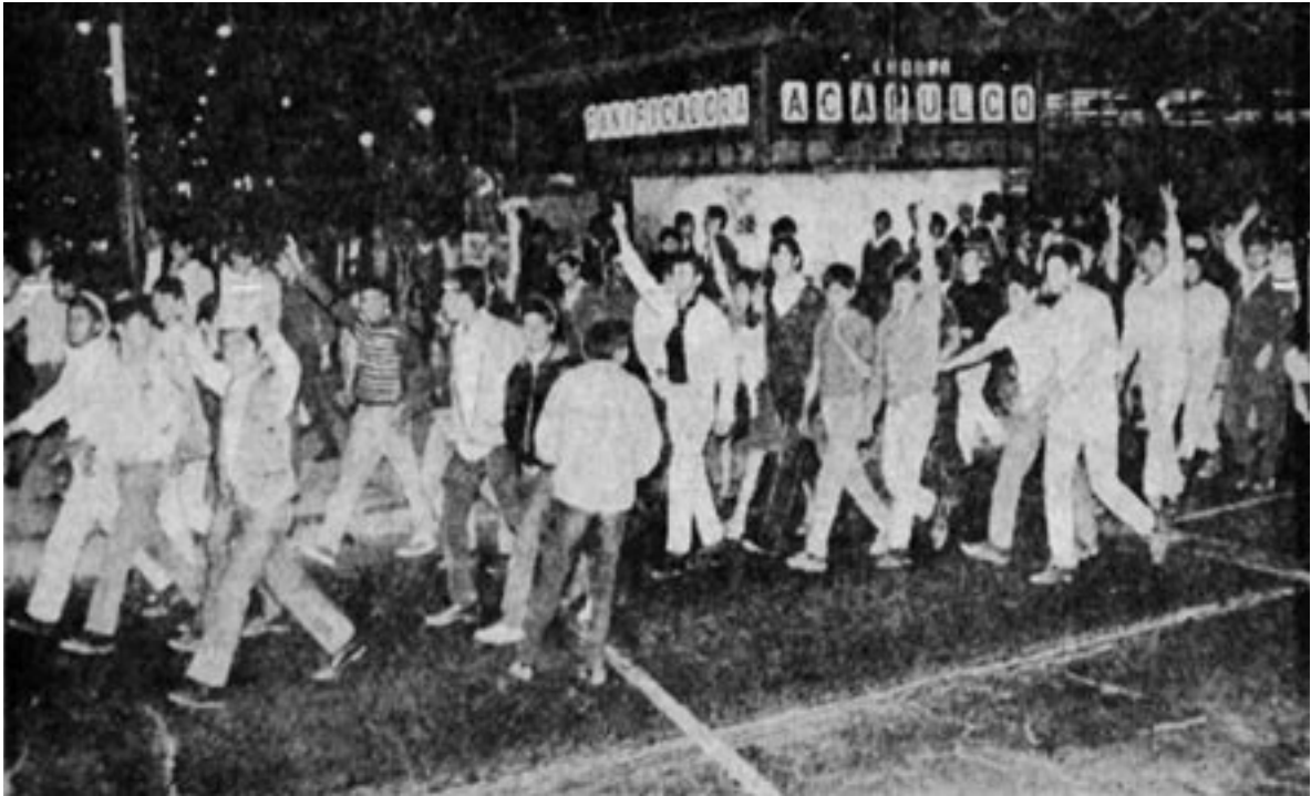
Figura 16. “Algunos estudiantes forman con los dedos la ‘V’ de la victoria, durante la manifestación realizada anoche de la Vocacional 7 (en Nonoalco Tlatelolco) al Hemiciclo a Juárez, donde fueron dispersados por la policía”. ( Excélsior , 26 de septiembre de 1968, p. 19. Archivo Histórico CESU, UNAM).