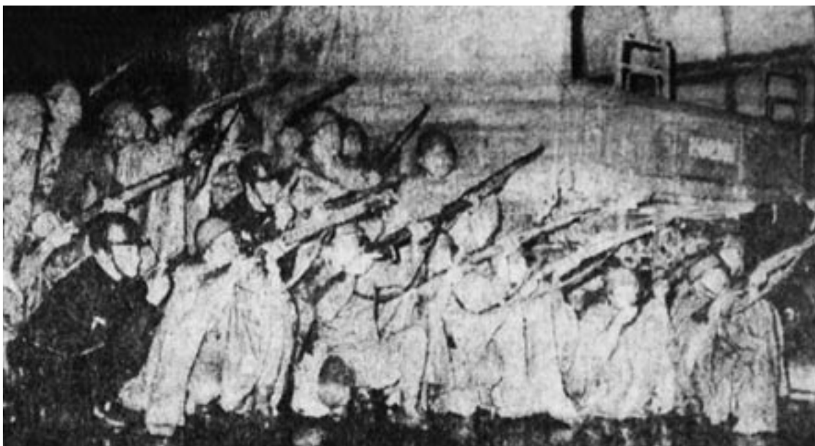
Figura 20. “Diecisiete fusiles de soldados y la pistola de un cabo de granaderos apuntaban hacia las ventanas del edificio Chihuahua —cuartel general del Comité de Huelga— desde donde se dice que fueron hechos algunos disparos de arma de fuego en contra de los miembros del Ejército que participaron en la operación. (Foto de Carlos González). ( Excélsior , 3 de octubre de 1968, primera plana. Archivo Histórico CESU, UNAM).