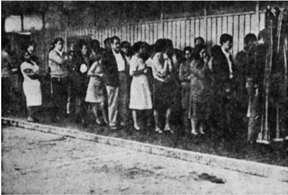
Figura 23. “Decenas de personas formaron filas ayer en el Servicio Médico Forense de la Procuraduría del Distrito para identificar cadáveres de caídos en el encuentro de manifestantes y soldados”. ( Excélsior , 4 de octubre de 1968, p. 1. Archivo Histórico CESU, UNAM).