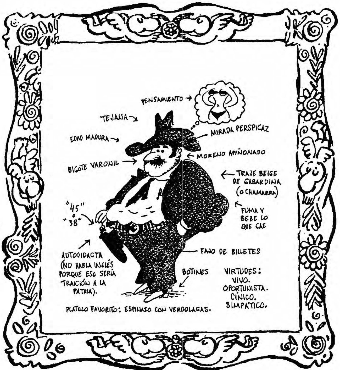
El político del PRI.