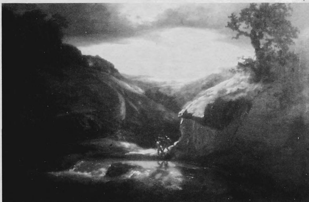
3. José María Velasco (1840-1912), La caza , 1865, óleo sobre tela, Museo Nacional de Arte.