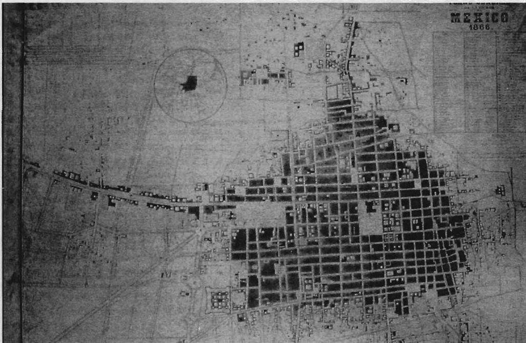
4. Carta General del Imperio, La ciudad de México , litografía y pluma, Mapoteca Orozco y Berra, SAGAR.