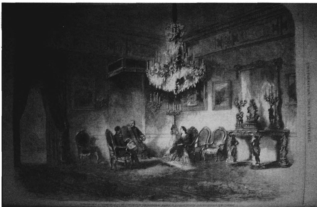
24. M. Laufberger, B. Cosson Smeetan, La visita de Maximiliano y Carlota al Papa , L'illustration , 7 de mayo de 1864, Universidad Iberoamericana.