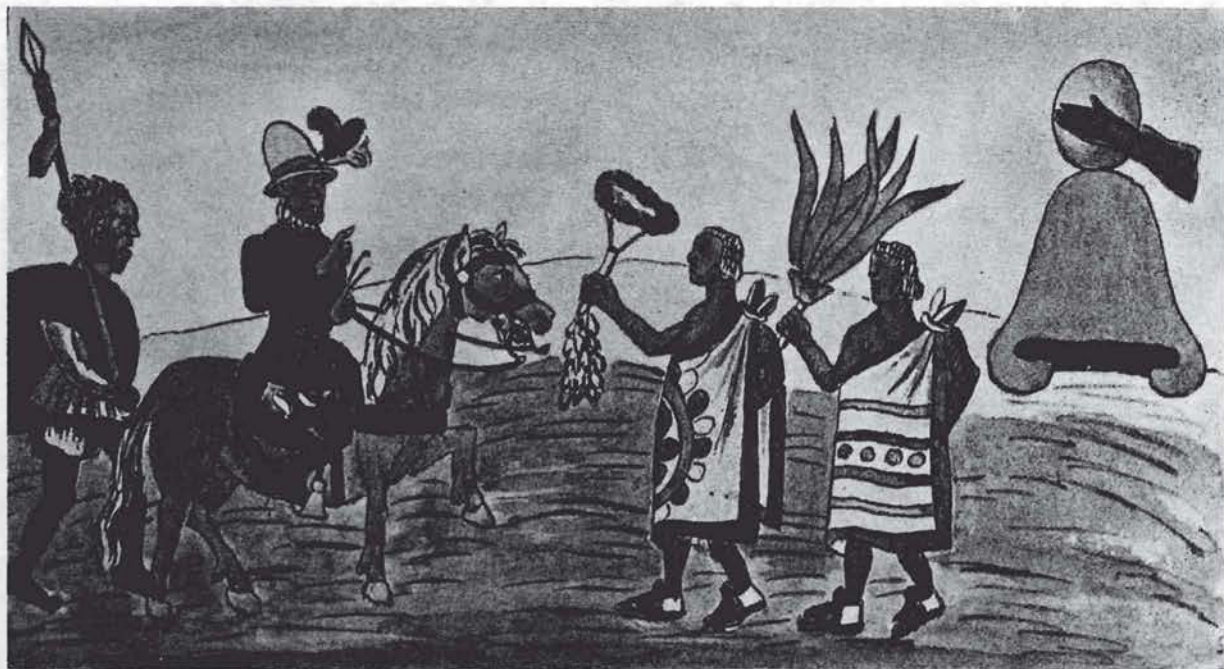
"De cómo los tlaxcaltecas tuvieron junta y consejo sobre recibir al marqués, de paz, y entregalle la ciudad y del gran recibimiento que le hicieron". Durán, título del Cap. LXXIII.