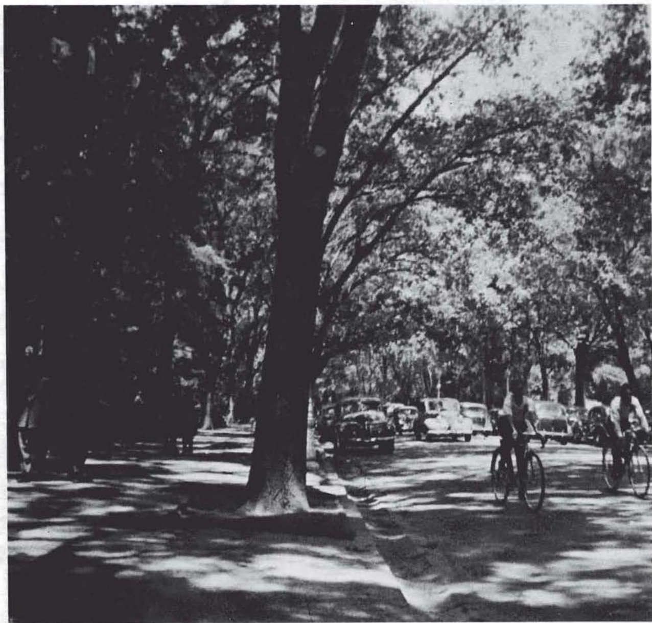
Paseo en el Bosque de Chapultepec.