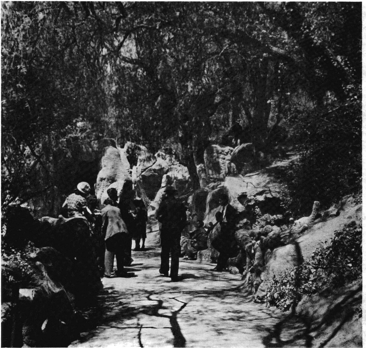
La gruta del Bosque.