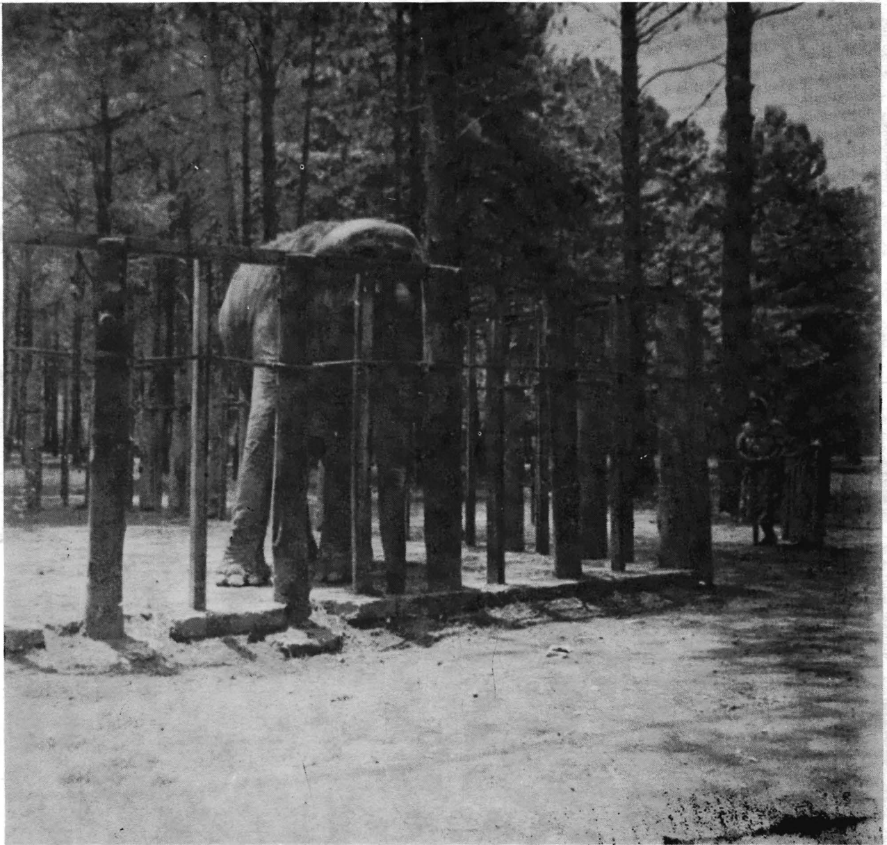
Zoológico de Chapultepec.