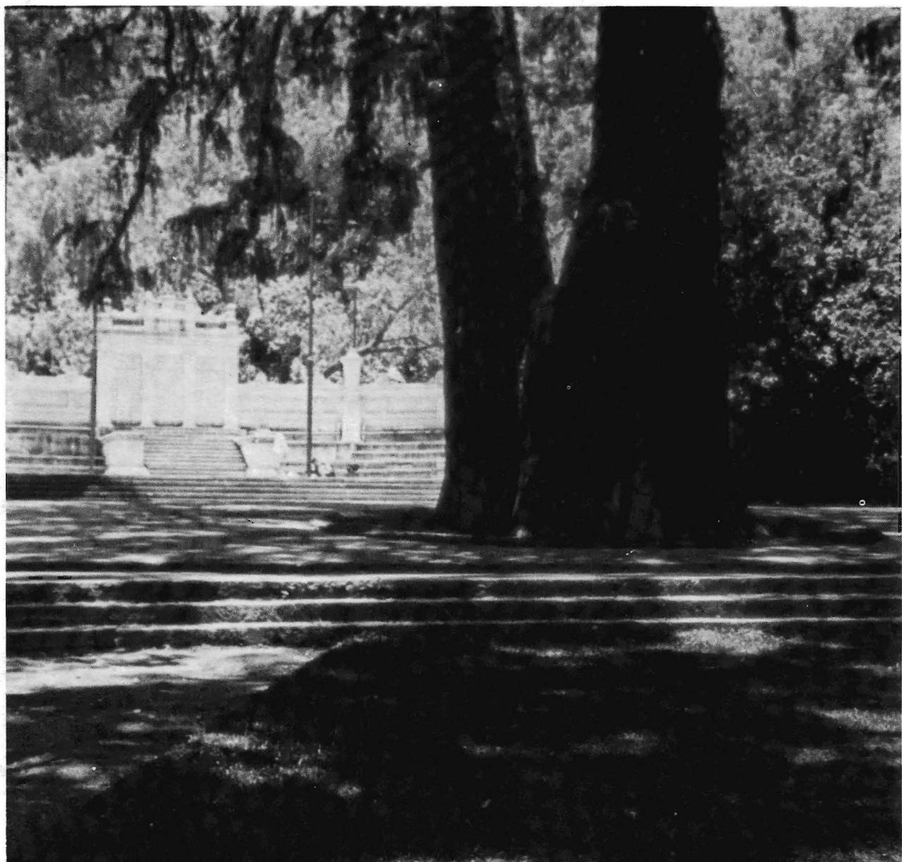
Monumento en honor a la Fuerza Aérea Mexicana.