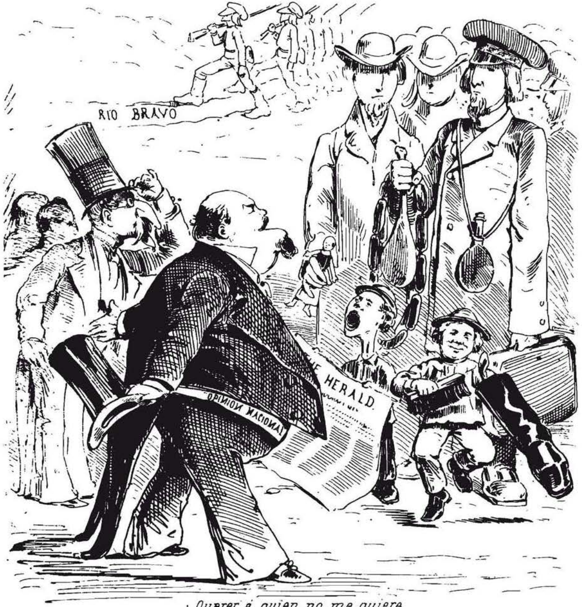
Querer a quien no me quiere Es verdadero querer.....