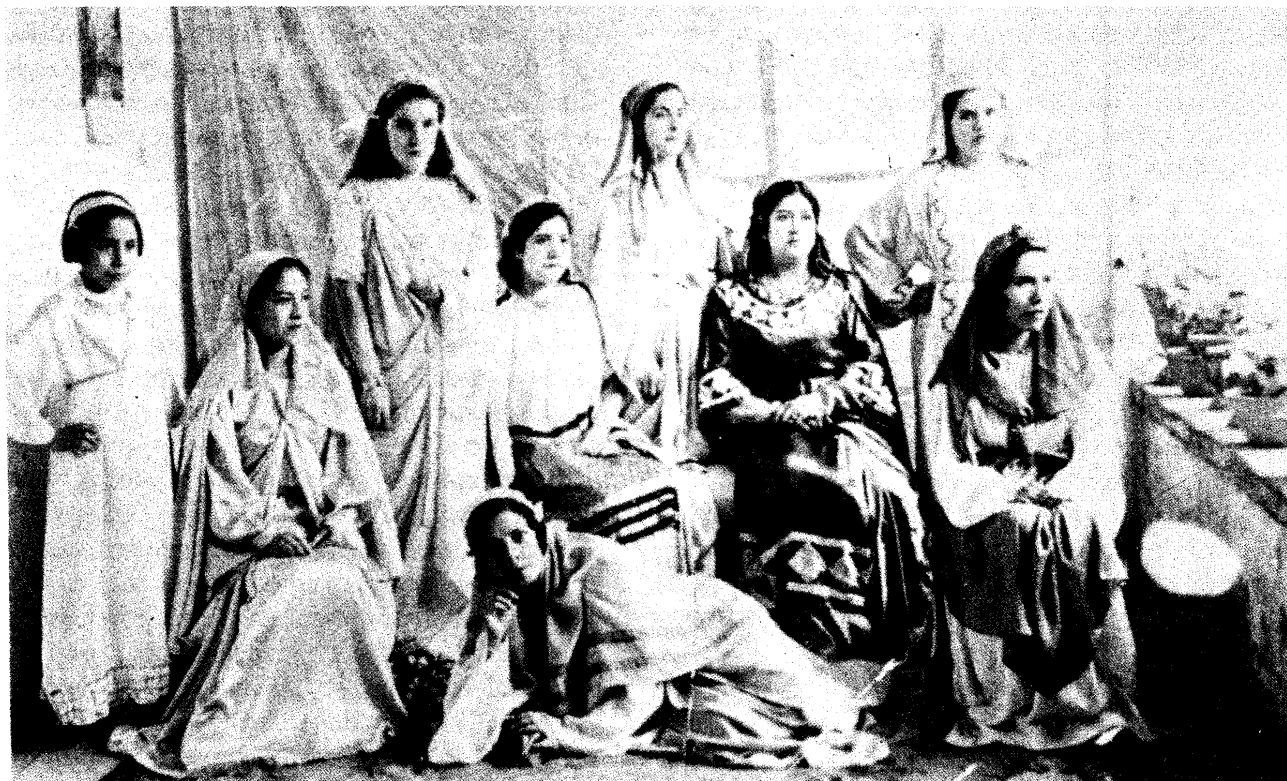
Hijas de mineros representan una obra de teatro en Angangueo. (Del libro Obreros somos... ).

El siglo presente podríamos dividirlo en dos periodos. El primero parte del auge industrial del porfiriato y nos lleva hasta los años de la institucionalización revolucionaria (de 1890 a los años treinta). El segundo comienza con un nuevo auge industrial en la década de los cuarenta y termina con la presente crisis económica. 21 Estos periodos incluyen importantes sucesos de orden político y económico, que no hace falta detallar aquí. Baste decir que la sociedad mexicana de 1950 es otra de la de 1900. Coinciden estos cortes con la periodización sugerida para el trabajo