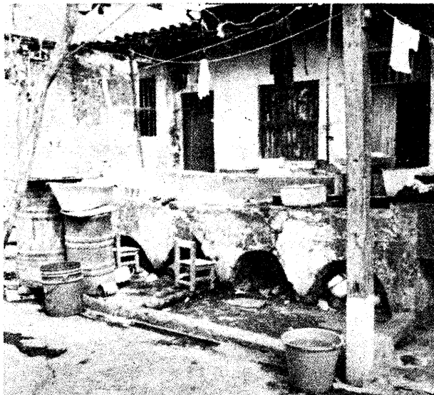
Viviendas y lavaderos de los estibadores veracruzanos. (Del libro Obreros somos... ).

El tipo de trabajo desempeñado también muestra diferencias entre mujeres de la tercera generación y sus madres y abuelas. La transformación durante la industrialización en el porfiriato condujo a cambios en el mercado de trabajo. En algunas áreas la industria textil empleó abundante mano de obra femenina. Curiosamente no fue así en Río Blanco, donde las textileras fueron pocas, concentradas todas en un departamento de la fábrica. Pero las migrantes llegaron con la costumbre de trabajar e ingresaron, sobretodo, al comercio y los servicios. 13 Eran fonderas,