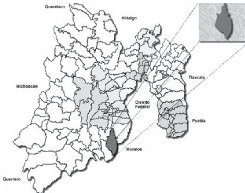
Mapa 1. Ubicación de Malinalco (fuente: Gobierno del Estado de México, “Mapas medio ambiente”)

Fuente: en línea [ http://www.edomexico.gob.mx/medioambiente/mapa/htm/consulta.asp?municipio=Malinalco ], consultado el 19 de julio de 2012.