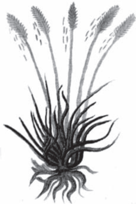
Figura 1. Hierba del malinalli (fuente: Martín de la Cruz, Libellus de medicinalibus indorum herbis. Manuscripto azteca de 1552 , México, IMSS, 1964, f. 12v.).

permanece incólume al paso de los siglos. El municipio se encuentra en la parte sur del estado de México, colinda al norte con los municipios de Joquizingo, al este con Ocuilan y al oeste con Tenancingo. Al sur con Zumpahuacan y el estado de Morelos. Malinalco tiene una altura que va de 1750 a 2000 metros sobre el nivel del mar. Su clima va del subhúmedo al cálido con precipitaciones abundantes, con un promedio anual de temperatura de 20-22 grados. Su etimología proviene del náhuatl ( malinal [li] + co [sufijo locativo]) “El lugar del malinalli ”. Es ésta una hierba alta, gramínea, que crece en zona altiplánicas semiáridas, cuyas hojas se extienden hacia los lados, así como tallos nudosos, largos y delgados, en la punta crecen flores amarillas en forma de espiguillas. Se le conoce como “Cola de zorro” o “Hierba o zacate del carbonero” (véase figura 1 y mapa 1).