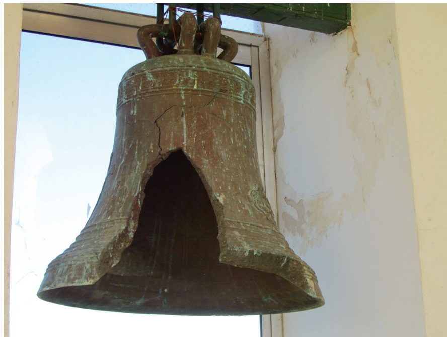
FIGURA 8. Campanario en ruinas. Detalle de la campana (Fotografía: María Guillermina Fressoli, 2010).