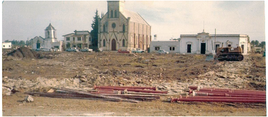
FIGURA 1. Antigua Ciudad de Federación en proceso de demolición (Fotografía: autor desconocido, 1977; cortesía: Archivo Museo de los Asentamientos (MA), Argentina).

su historia social y urbana; aspecto que se describe a continuación.