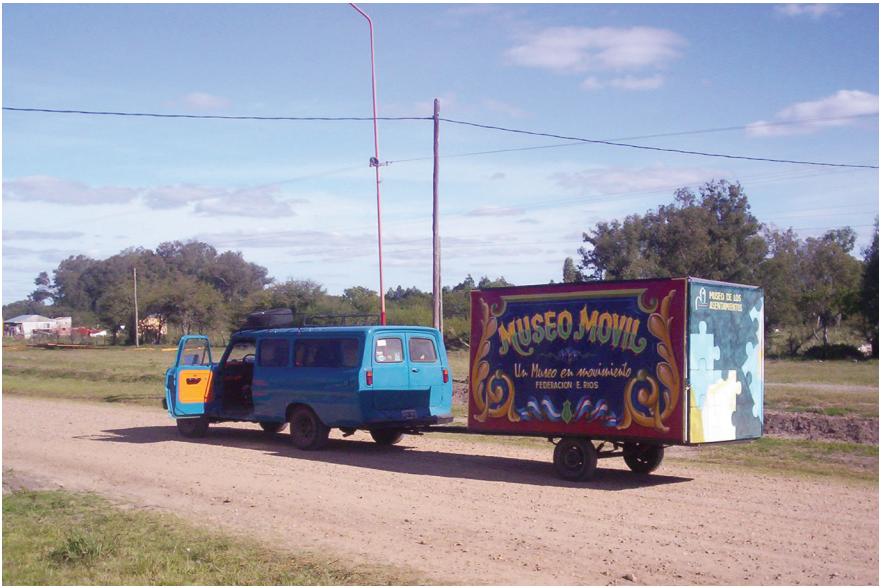
FIGURA 6. Museo Móvil (MM) desplazándose.

diferentes puntos del espacio urbano y desplegar su acervo en el formato de exposición efímera 19 (Figura 6).