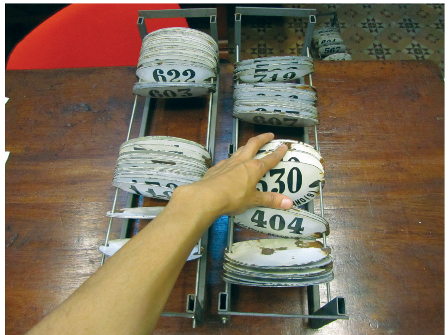
FIGURA 11. Números pertenecientes a las casas de antigua Federación dispuestos en rieles.