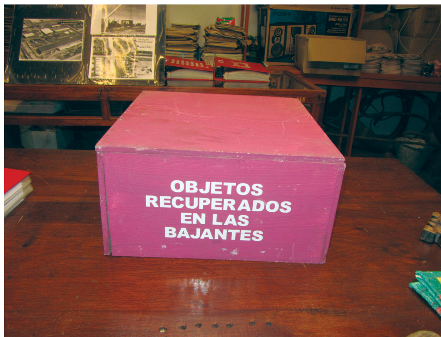
FIGURA 12. Cajón usado para incorporar los objetos que suelen traer las bajantes del río. Atrás se observan las carpetas que contenían los registros de todas las casas destruidas, cuyos datos eran completados a medida que los miembros de la comunidad los reconocían.

considera que, de acuerdo con la labor del museo, el recuerdo se plantea fundamentalmente como experiencia. La perdurabilidad de esta forma de figurar el pasado que toma como su contenido la acción, sólo deja como legado los residuos de una experiencia a aquellos que han tenido posibilidad de participar del surgimiento del relato. La perdurabilidad del testimonio se limita a esta característica, sin poder trascender en la forma de un legado documental. Es posible por ello inferir que la pretensión de permanencia en el marco del MM se manifiesta sujeta al tiempo en que el museo se traslada y, en tal sentido, adquiere un carácter provisorio.