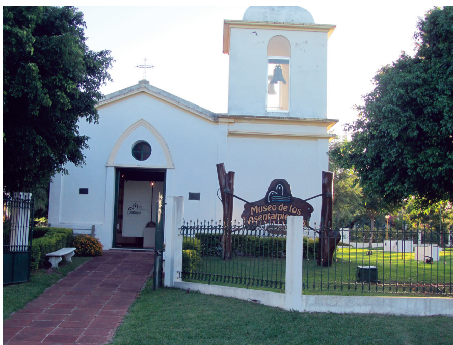
FIGURA 5. Museo de los Asentamientos (MA) (Ex Museo de las Regiones [MR]) emplazado en Nueva Ciudad de Federación.

sobre la función del museo y sus cambios. Según Eduardo Rinesi (2011:10), la institución museal originalmente tenía como función legitimar