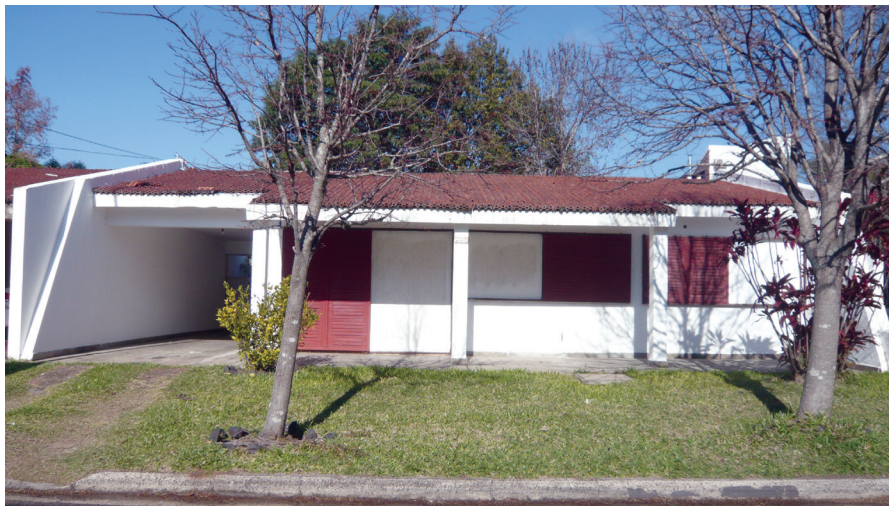
FIGURA 4. Detalle de las casas de Nueva Federación.