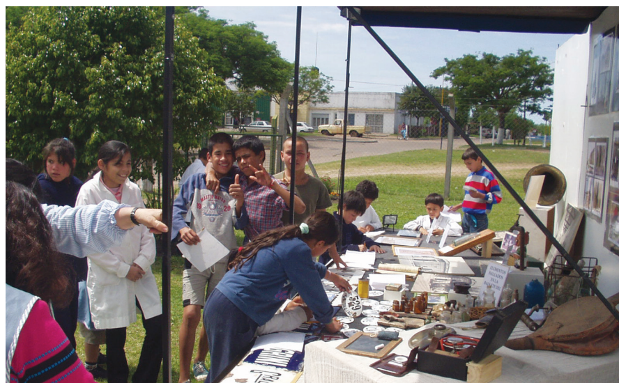
FIGURA 9. Museo Móvil en despliegue. Puede observarse la situación de mirada en torno a la mesa que genera el carromato abierto (Cortesía: Archivo Museo de los Asentamientos (MA), Argentina).

las miradas entre visitantes no necesariamente se cruzan y/o encuentran.