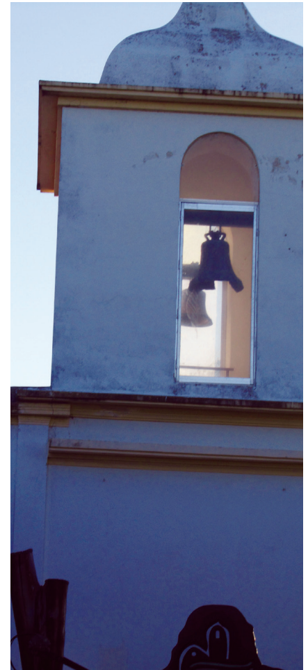
FIGURA 7. Campanario en ruinas, vista exterior del Museo de los Asentamientos (MA) (Fotografía: María Guillermina Fressoli, 2010).

lar la mirada sobre el pasado. En ese sencillo gesto, el traslado, que había quedado paralizado en la presencia testimonial del edificio colonial, se reactualizó en un nuevo entorno y bajo una nueva modalidad.