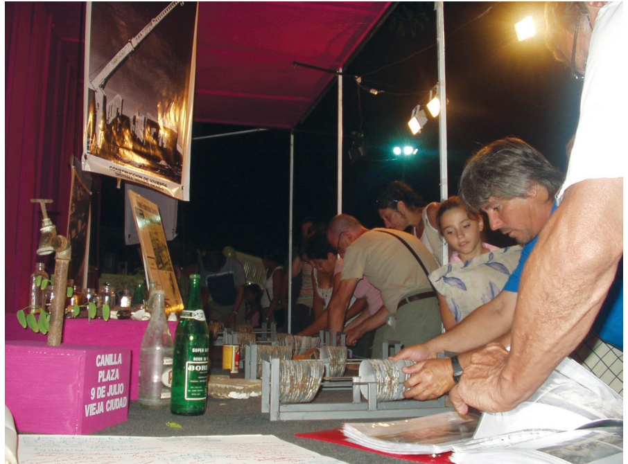
FIGURA 10. Museo Móvil (MM) en despliegue (Fotografía: autor desconocido, 2005; cortesía: Archivo Museo de los Asentamientos MA, Argentina).

del museo en la ciudad y como modalidad de consulta de los archivos/colecciones), interpelaron una afectación que tiene por objeto la pregunta por lo propio en la arena pública. El artefacto del MM y sus dispositivos de exhibición evidencian una estra-