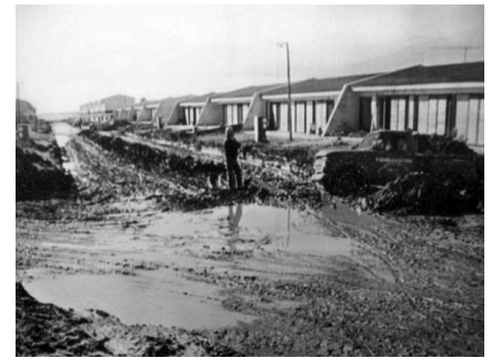
FIGURA 2. Detalles de las casas de Nueva Federación en el estado en el que se encontraban al momento de la mudanza (Fotografía: autor desconocido, 1979; cortesía: Archivo Museo de los Asentamientos (MA), Argentina).

Así, las transformaciones sensibles del espacio 5 y sus efectos sobre las