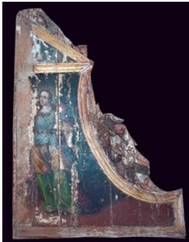
FIGURA 8. Santa Catalina . Imagen con luz visible (Fotografía: Eumelia Hernández Vázquez, 2012; cortesía: Laboratorio de Diagnóstico de Obras de Arte [LDOA], Instituto de Investigaciones Estéticas [IIE], Universidad Nacional Autónoma de México [UNAM], México).

En cuanto a la tercera pintura de forma rectangular (Figura 9), representa la crucifixión. En un paisaje nocturno, la escena presenta a Jesús clavado en una cruz. Él se acompaña de la Virgen María en sollozo, por el acontecimiento de su muerte; de Juan Evangelista, con gesto compasivo y triste, en el extremo derecho y de María Magdalena, hincada al pie de la cruz, que abraza los pies del Señor. En esta escena claroscuro resaltan los personajes sobre el fondo oscuro y plano; su aspecto formal y compositivo nos indica una temporalidad distinta del siglo XVI; sin embargo, la composición subyacente se desarrolló en un paisaje a cielo abierto con luz de día, como lo demostró el estudio de la imagen por medio de luz UV, rayos X y los cortes transversales. Del cuerpo de Cristo salía un amplio resplandor dorado que iluminaba toda la escena, y el colorido de la composición era de una paleta brillante y clara. La aplicación del color elaborada a partir del manejo dinámico —y con gran cantidad de material— del pincel formó empastes que se fundieron gradualmente entre colores complementarios para la degradación de luz y la notoriedad de las sombras. Mientras tanto, para los pliegues la pincelada se trabajó con soltura