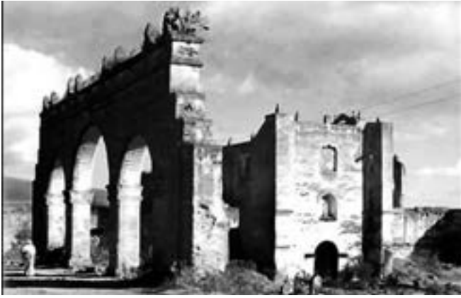
FIGURA 2. Detalle del ex convento de San Francisco Tepeyanco, Tlaxcala, antes de su restauración. Destaca el estado de abandono del conjunto arquitectónico. En la zona inferior derecha se observa el panteón que durante la restauración de 1990 se removió y convirtió en jardín (Fotografía: s. f., siglo XX; cortesía: Archivo de Restauración del Centro INAH Tlaxcala-Instituto Nacional de Antropología e Historia [INAH], México).

La historiografía de este espacio describe los diversos conflictos o conciliaciones sociales sobre sus funciones durante la época novohispana; sin embargo, no existe pesquisa que trate sobre el ajuar eclesiástico y los retablos que debieron insertarse en el interior del templo en ese periodo. Incluso así, el estudio de la construcción indica que para el siglo XVI Tepeyanco, como otras fundaciones franciscanas del valle Puebla-Tlaxcala (Cuauhtinchan, Tecali y Huejotzingo), comparte características arquitectónicas y de presentación de un retablo principal en el ábside (Cano 2014: 25-75).