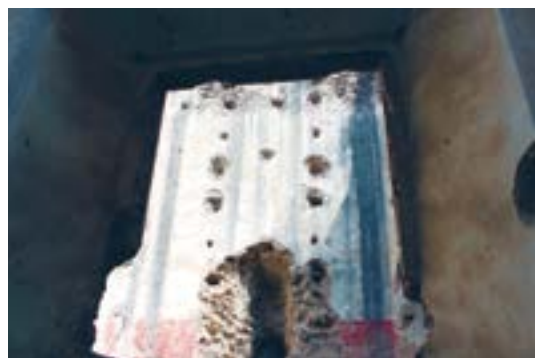
FIGURAS 4. Se observa la forma octogonal del ábside y los espacios que recibieron los polines que mantuvieron en pie el retablo.