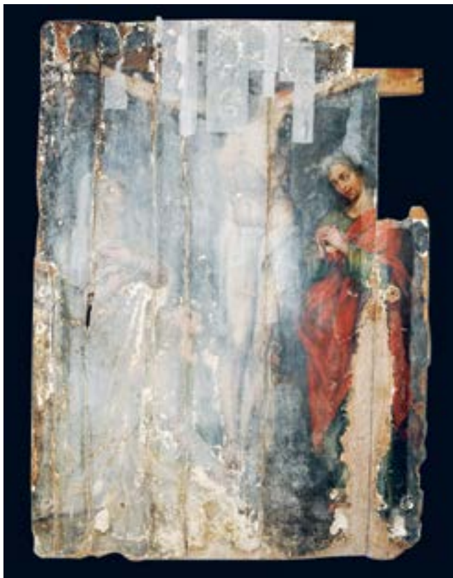
FIGURA 9. Crucifixión . Imagen con luz visible.