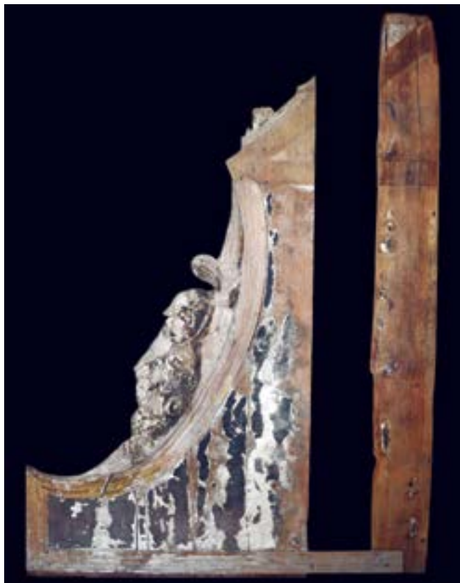
FIGURA 7. Panel lateral izquierdo. Imagen con luz visible.

personajes devotos a María o Cristo, así como ejemplos a seguir en la vida religiosa: su aparición en las calles laterales o entrecalles de los remates en los retablos comparados de Tecali, Cuauhtinchan y Huejotzingo dan muestra de ello.