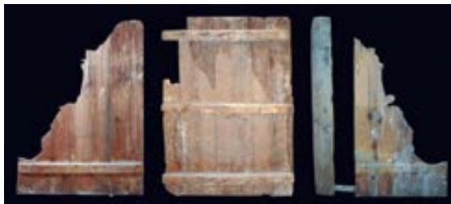
FIGURA 10. Detalle de reverso de la Crucifixión , Santa Catalina y el panel lateral izquierdo.

En cuanto a la construcción del panel, las tres pinturas presentan cuatro tablones unidos entre sí con una capa de adhesivo orgánico. Cada tablero se sostiene por