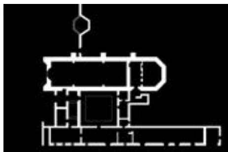
FIGURA 5. En el esquema se ve la planta arquitectónica del templo y convento franciscano de Tepeyanco (Esquema: Juan Carlos Ramírez, 2012; cortesía del autor).