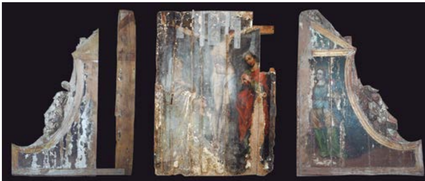
FIGURA 1. Crucifixión, Santa Catalina y panel lateral izquierdo. (Fotografía: Eumelia Hernández Vázquez, 2012; cortesía: Laboratorio de Diagnóstico de Obras de Arte [LDOA], Instituto de Investigaciones Estéticas [IIE], Universidad Nacional Autónoma de México [UNAM], México).