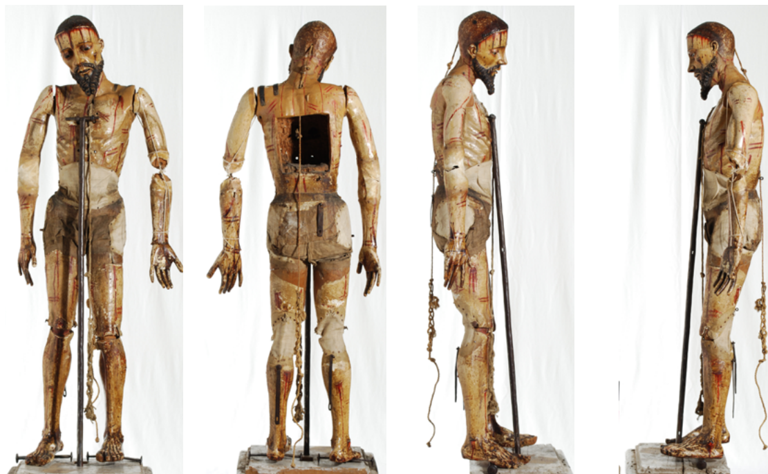
FIGURA 4. El Señor de las tres caídas . Vistas generales desvestido, inicio de proceso.

La pieza corresponde a la efigie de Cristo tallada en madera de pino ayacahuite ( Pinus ayacahuite sp.), 14 con articulaciones en cuello, estómago y cadera, hombros, brazos y piernas, que personifica durante su procesionado por lo menos cinco de las estaciones del viacrucis. 15 Por ello se le conoce como El Señor de las tres caídas (Figura 4), y se ha propuesto que su ejecución probablemente corresponda a finales del siglo xvii o principios de la centuria siguiente.