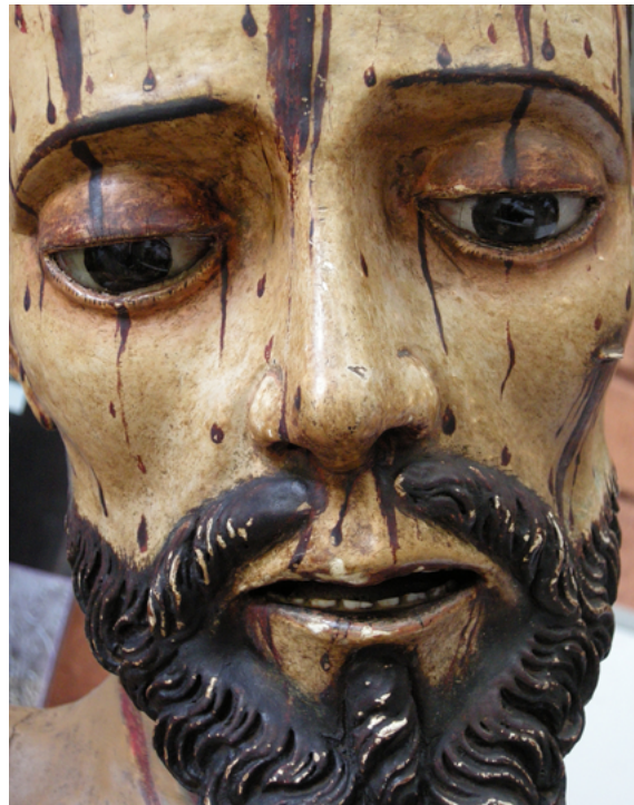
FIGURA 7. El Señor de las tres caídas . Inserción de ojos y dientes durante el proceso del tallado.

heridas, y trabajadas desde los aparejos— también serían ejemplos de elementos empleados para acentuar la expresividad, que fungen no sólo como añadidos, sino, igualmente, como recursos escultóricos.