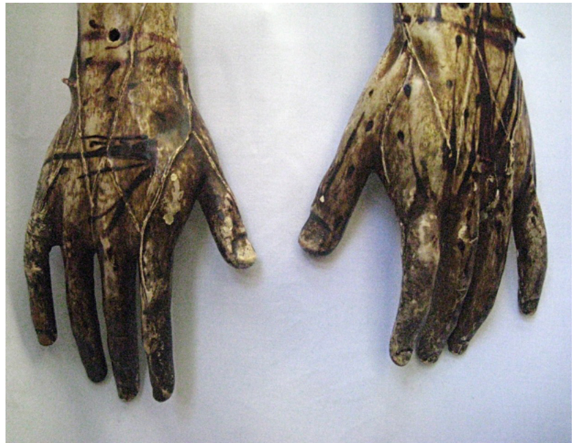
FIGURA 6. El Señor de las tres caídas . Orificio de anclaje para sostener la mano; detalles de heridas y venas de la mano izquierda.

p. 231)— como la peluca. Después de concretar su estudio radiológico, se sabe que los ojos son de vidrio con forma de “cazuela”, es decir, que se hicieron con una delgada lámina vítrea a la que se le dio forma cóncava con ayuda de un molde, o superficie, apto para ello. 18 Esas piezas están pintadas por la parte posterior, donde se aprecian las pinceladas 19 (Figura 7). Además, tienen —en el informe se indican como añadidos (Gutiérrez et al. , 2010)— dientes de hueso en ambas mandíbulas, los cuales se tallaron de forma independiente e incrustaron en el soporte uno a uno.