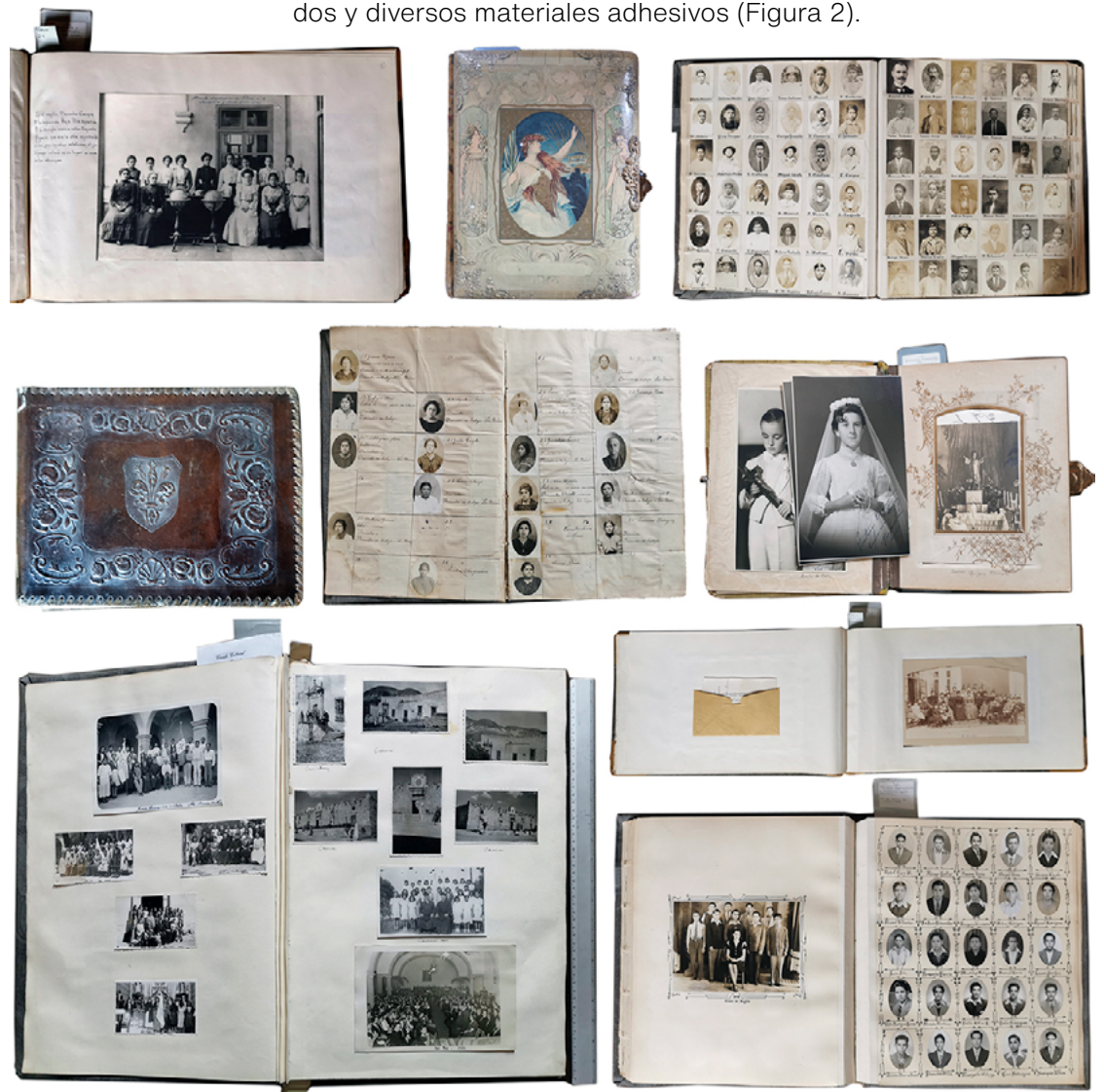
FIGURA 2. Muestra de la diversidad de álbumes fotográficos de la colección de la BRBA (Fotografía: Amaranta González, 2021; cortesía: Biblioteca Ricardo B. Anaya, San Luis Potosí, México).

Los encuadernados de la colección presentan diferentes dimensiones, carteras y métodos de sujeción de las imágenes; los impresos fotográficos que contienen son, asimismo, de distintos formatos y naturaleza técnica, aunque la mayoría son imágenes impresas en blanco y negro. En estos álbumes las fotografías se encuentran asociadas con otras materias primas, entre las que hay presencia de folios manuscritos, esquemas dibujados, documentos impresos, textiles, estampas, piel, celuloide, papeles estilizados y diversos materiales adhesivos (Figura 2).