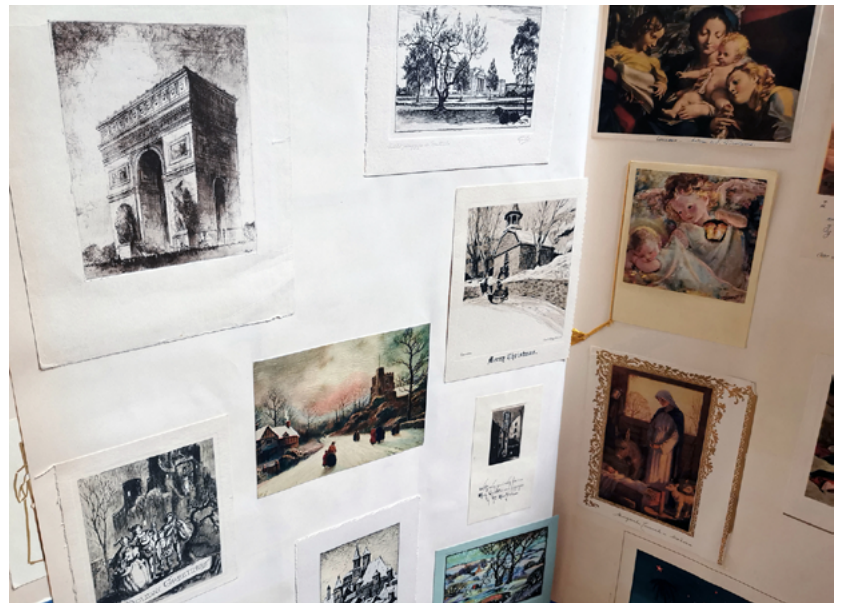
FIGURA 3. Ejemplo de grabados y participaciones entre los misceláneos de los álbumes de la BRBA (Fotografía: Amaranta González, 2021; cortesía: Biblioteca Ricardo B. Anaya, San Luis Potosí, México).

Si bien se podría pensar que esta colección responde a intereses meramente vinculados con la Iglesia católica, en realidad el amplio acervo contiene gran variedad de fotografías que retratan todo tipo de personajes: de la vida política, cultural y, en general, de la sociedad potosina así como lugares y edificios antiguos de diversas ciudades en San Luis Potosí, México.