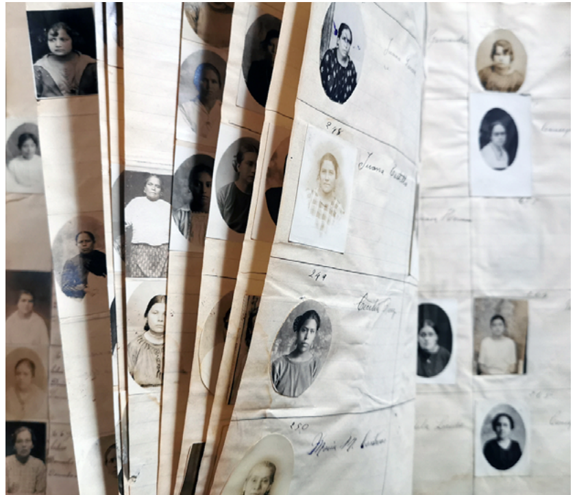
FIGURA 6. Ejemplo de alteración a causa de la manipulación del álbum. En la imagen se aprecia la variedad de formatos y la ubicación de las imágenes dentro del encuadrado.