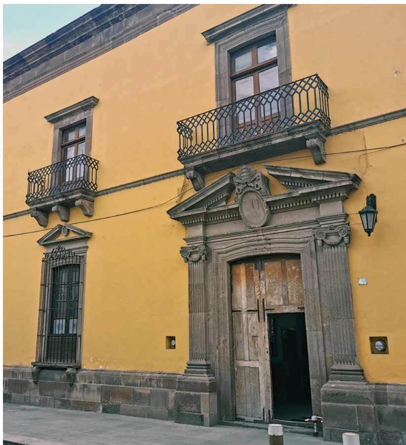
FIGURA 1. Fachada del inmueble de la Acción Católica, en la ciudad de San Luis Potosí.

La BRBA es única en muchos sentidos, ya que, si bien se encuentra albergada en un inmueble que es propiedad de la Arquidiócesis de San Luis Potosí, la administra el Círculo Cultural Ricardo B. Anaya, el cual se encarga completamente de su funcionamiento. En cuestión financiera, depende de las donaciones de benefactores que mensualmente aportan cantidades modestas para su mantenimiento (Figura 1).